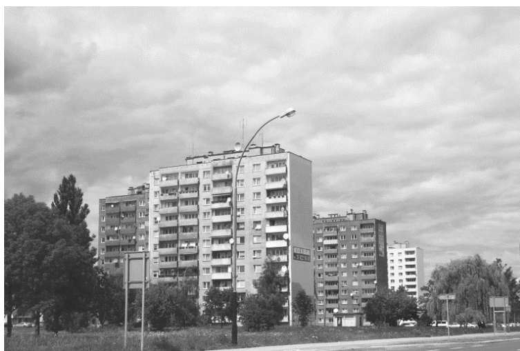
Ryc. 3. Osiedla górnośląskie wykonane w technologii prefabrykatów

Wymienione powyżej krajobrazy śląskie wraz ze swoją specyfiką i podziałem nie wyczerpują wszelkich możliwych typów, szczególnie gdy są ze sobą mocno związane. (Herńnik, Olejniczak 2007). Na krajobraz wpływa również obecność hut, fabryk, hałd, osiedli i komunikacji (Ryc. 2a, 3.), które to elementy zazwyczaj postrzegane są jako nieestetyczne. Okazuje się jednak, że nagromadzenie tych elementów jest powodem rozwoju specyficznej turystyki ( www.polskieszlaki.pl/atrakcje/ , www.slask.travel/page,18/turystyka%20na%20Slasku.html , data pobrania 13.04.2016), co można prognozować jej dalszy rozwój, przy odpowiednim propagowaniu.