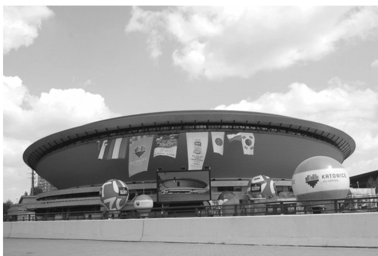
Ryc. 2a, 2b. Różnorodność współczesnej architektury Górnego Śląska: elektrownia i katowicki „Spodek”