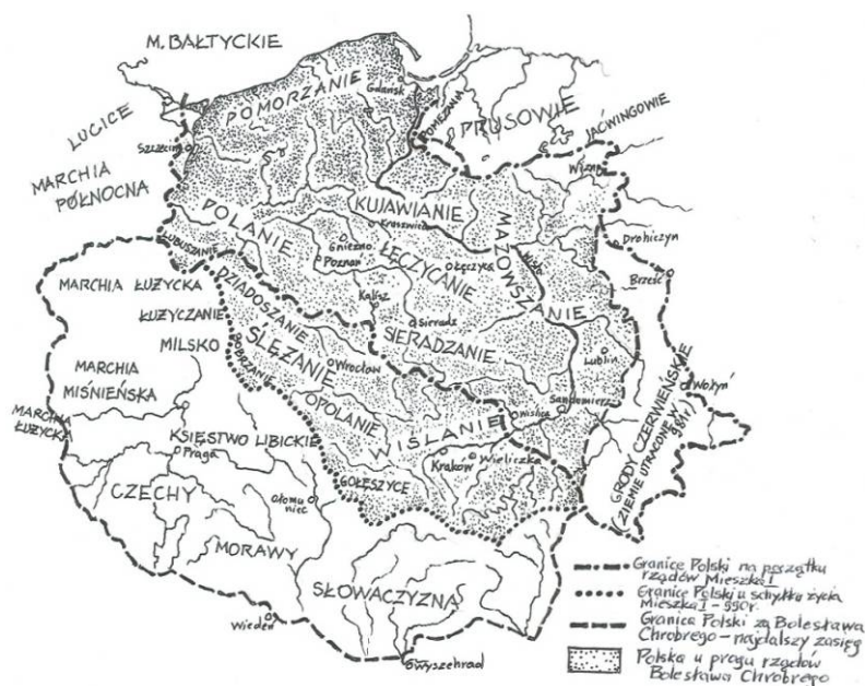
Ryc. 1. Ziemie Państwa Polskiego w czasach Mieszka I i Bolesława Chrobrego

Na pierwszym zjeździe wyszehradzkim Jan Luksemburski zrzekł się pretensji do korony polskiej za cenę 20 000 kóp groszy praskich. Od Kazimierza Wielkiego zażądał uznania zwierzchnictwa czeskiego nad Śląskiem. Nie uzyskując przywództwa, rozpoczął wojnę podjazdową z Polską, zaś pokój podpisany w Namysłowie w roku 1356 wzmacniał niestety przynależność Górnego Śląska do Czech.