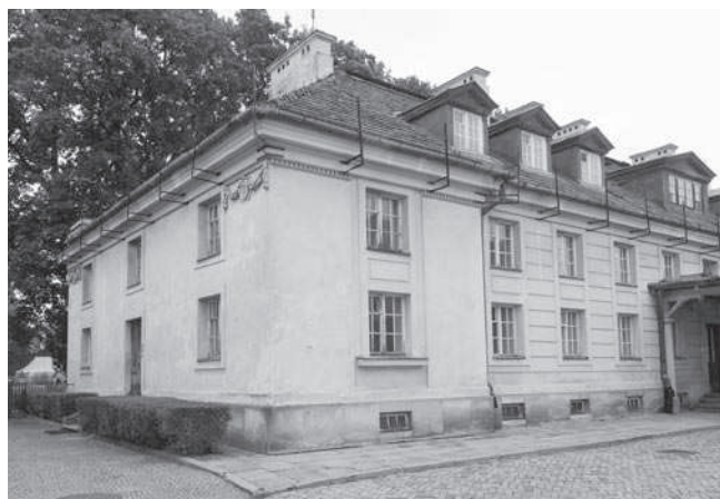
Rys. 3. Widok elewacji budynku kuchni od strony południowo-zachodniej przed rozpoczęciem prac remontowych i konserwatorskich.