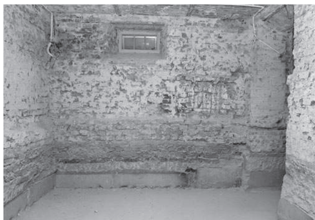
Rys. 4. Widok przestrzeni piwnic po skuciu starych tynków i odsłonięciu ceglano-żelaznego wiatku.