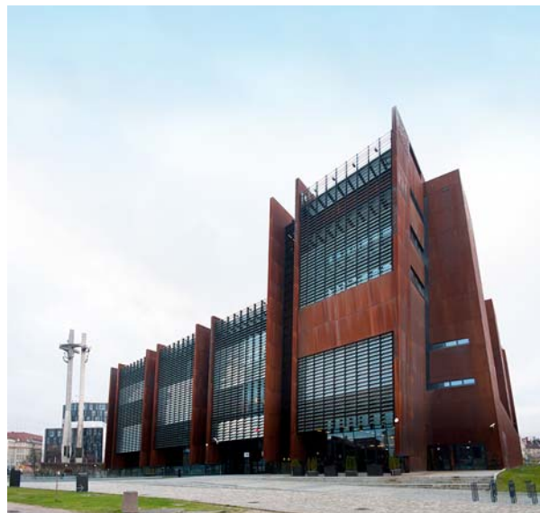
Ryc. 14. Europejskie Centrum Solidarności od strony terenów dawnej stoczni.

Fig. 12. European Solidarity Centre from the side of the historic entrance gate to the Shipyard.