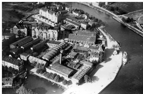
Ryc. 6. Archiwalne zdjęcie terenu inwestycji.

Budynek Muzeum, wyłoniony na podstawie międzynarodowego konkursu, jest metaforą. Twórcy zapisali jego przestrzeń w trzech strefach: przeszłości, teraźniejszości i przyszłości. Ta niezwykle czytelna definicja przestrzeni generuje układ urbanistyczno-architektoniczny,