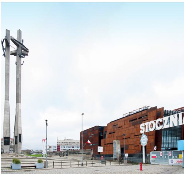
Ryc. 12. Europejskie Centrum Solidarności od strony historycznej bramy wejściowej do Stoczni.

Fig. 12. European Solidarity Centre from the side of the historic entrance gate to the Shipyard.