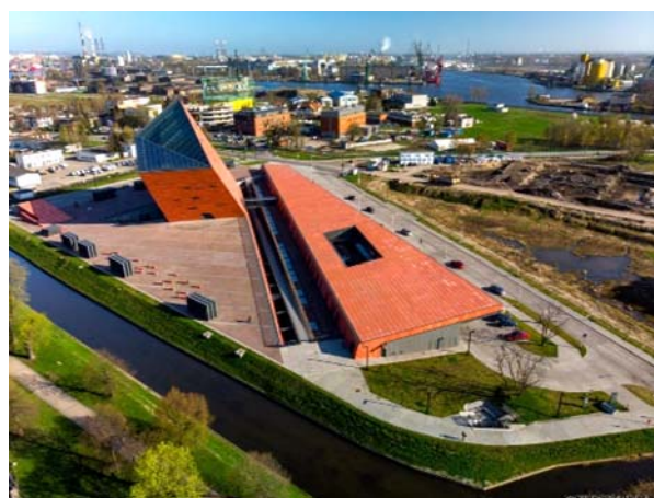
Ryc. 7. Muzeum II Wojny Światowej wraz z zagospodarowaniem terenu.