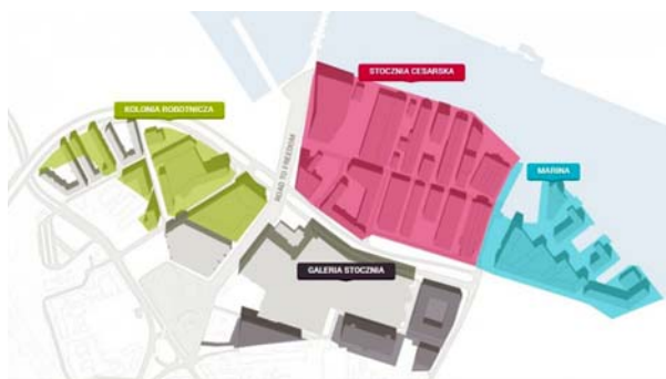
Ryc. 4, 5. Obszar inwestycji Młode Miasto na tle obszarów należących do Stoczni oraz podstawowe strefy funkcjonalne terenu.