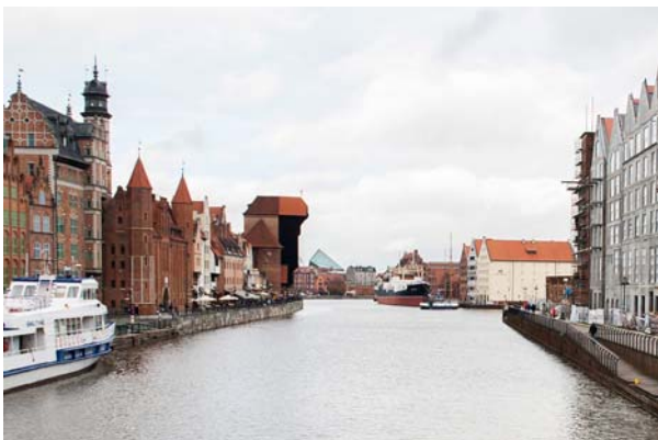
Ryc. 8. Kanał Motławy z widocznym w perspektywie Muzeum Wojny.

Fig. 8. The Motława Channel with the Museum of the Second World War visible in the perspective.