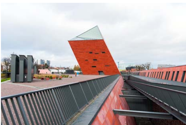
Ryc. 10. Trzy strefy Muzeum Wojny: Przeszłość, Teraźniejszość i Przyszłość.

Fig. 9. Museum of the Second World War with the Radunia Channel.