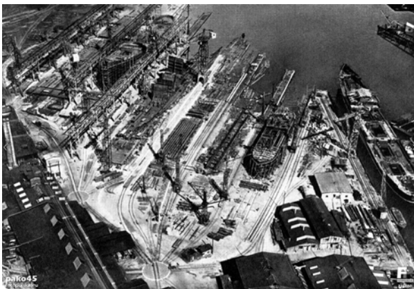
Ryc. 3. Pochylnie Stoczni Schichaua, 1911.