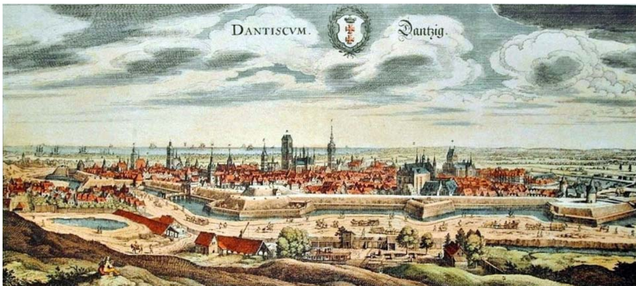
Ryc. 1. Historyczna panorama Gdańska, 1650–1655. Autor: Mathäus Merian. Fig. 1. Historical panorama of Gdańsk, 1650–1655. Author: Mathäus Merian.