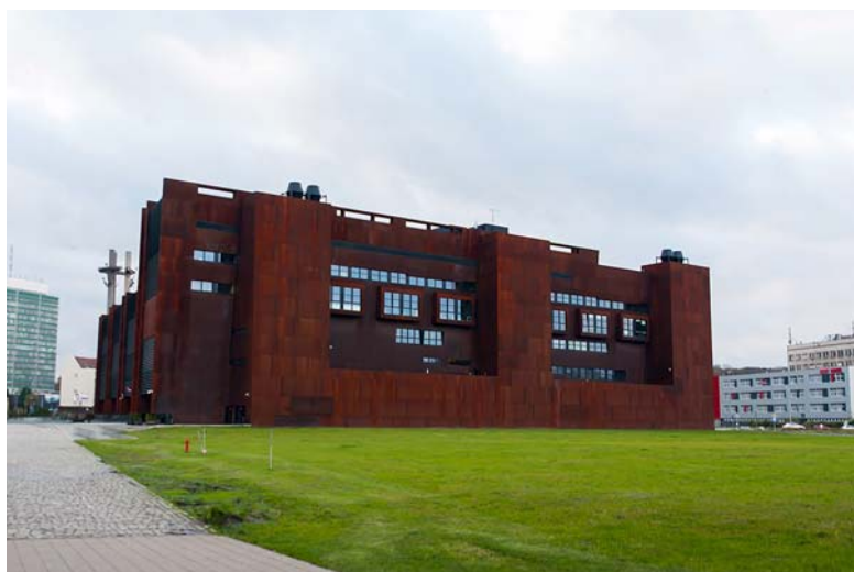
Ryc. 13. Europejskie Centrum Solidarności od strony budynku sali BHP.

The building itself, which with its spatial form makes a reference to a hull, is divided into two functional zones. The first one is addressed to the mass audience, offering spaces of a multimedia library, an