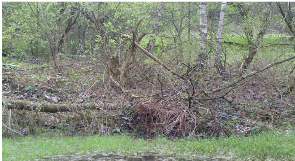
Fot. 3. Uschnięte drzewa w obrębie niecki składowiska Phot. 3. Dried-up trees in the area of landfills basin

Na składowisku przeprowadzono pomiar gazów detektorem „Duo Master”, który wykazał stężenie metanu przekraczające 20%. Wynika to najprawdopodobniej z wysokiej wilgotności złoża odpadów, co sprzyja procesowi metanogenezy. Namacalnym efektem emisji i migracji gazów CH 4 i CO 2 są usychające drzewa w obrębie niecki składowiska (fot. 3).