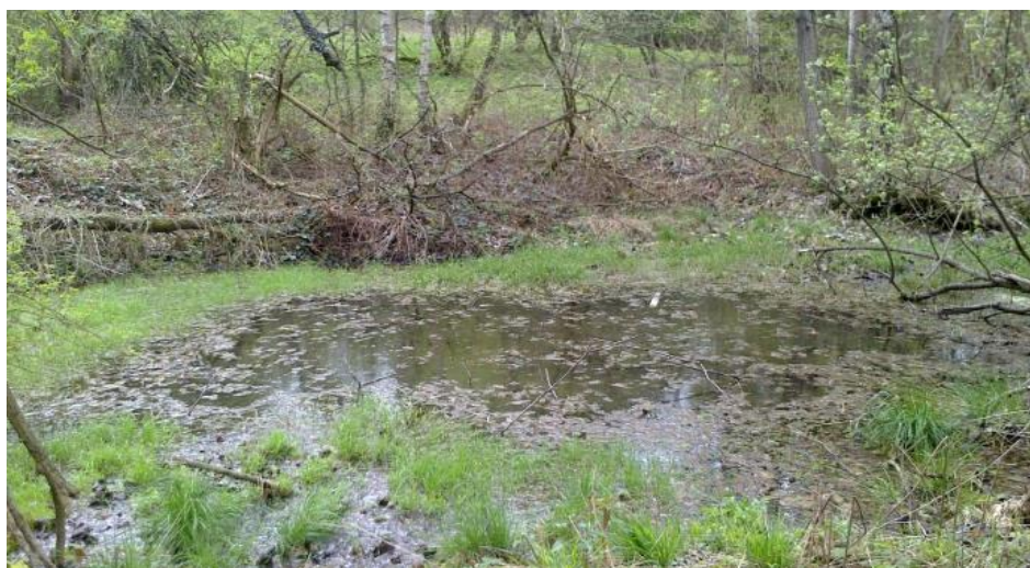
Fot. 1. Zastoisko wodne na koronie składowiska Phot. 1. Impounded water on the landfill crown

Z uwagi na niewłaściwe ukształtowanie bryły składowiska oraz brak uszczelnienia jego wierzchowiny nadmiar wód opadowych przelewając się przez koronę składowiska powoduje niszczenie skarp obwałowania kwatery (erozja wodna) oraz tworzenie się podłużnych wcięć (żłobin), które w istotny sposób przyczyniają się do utraty stateczności skarp (fot. 2).