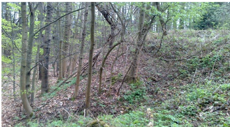
Fot. 2. Erozja wodna skarp obwałowania Phot. 2. Escarpments water erosion

Z uwagi na niewłaściwe ukształtowanie bryły składowiska oraz brak uszczelnienia jego wierzchowiny nadmiar wód opadowych przelewając się przez koronę składowiska powoduje niszczenie skarp obwałowania kwatery (erozja wodna) oraz tworzenie się podłużnych wcięć (żłobin), które w istotny sposób przyczyniają się do utraty stateczności skarp (fot. 2).