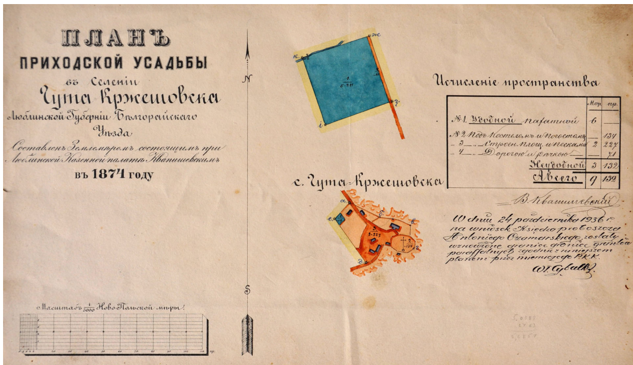
Ryc. 1. Plan zabudowań parafialnych wykonany w 1874 roku. Zbiory archiwum parafialnego w Hucie Krzeszowskiej Fig. 1. Plan of parish buildings drawn in 1874. Collection of the parish archive in Huta Krzeszowska