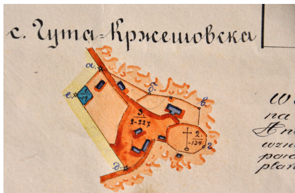
Ryc. 2. Fragment planu zabudowań z 1874 roku. Na tzw. „Pagórku Piaszczystym” w Hucie Krzeszowskiej wzniesiono kościół parafialny w 1766 roku. Zbiory Archiwum Parafialnego w Hucie Krzeszowskiej Fig. 2. Fragment of the plan of buildings from 1874. The parish church was erected in 1766 on the so called “Pagórek Piaszczysty” in Huta Krzeszowska. Collection of the Parish Archive in Huta Krzeszowska

mentem zostały zaktualizowane decyzje wydane w latach 60. XX wieku; ponadto jedną wspólną decyzją objęto zabudowania powstałe w obrębie zabytkowego zespołu kościoła parafialnego w Hucie Krzeszowskiej.