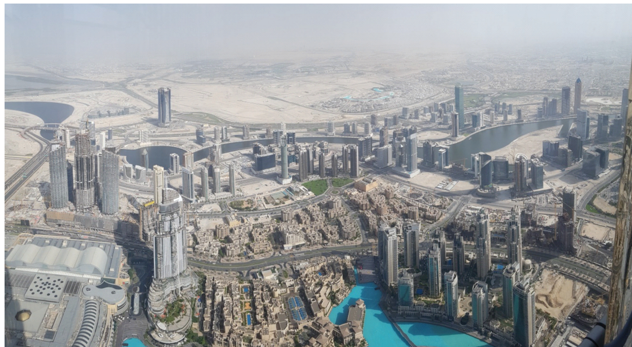
II. 3. Widok Dubaju z tarasu At The Top Sky (piętro 148). Dubai viewed from the upmost terrace (At the Top Sky, storey 148).