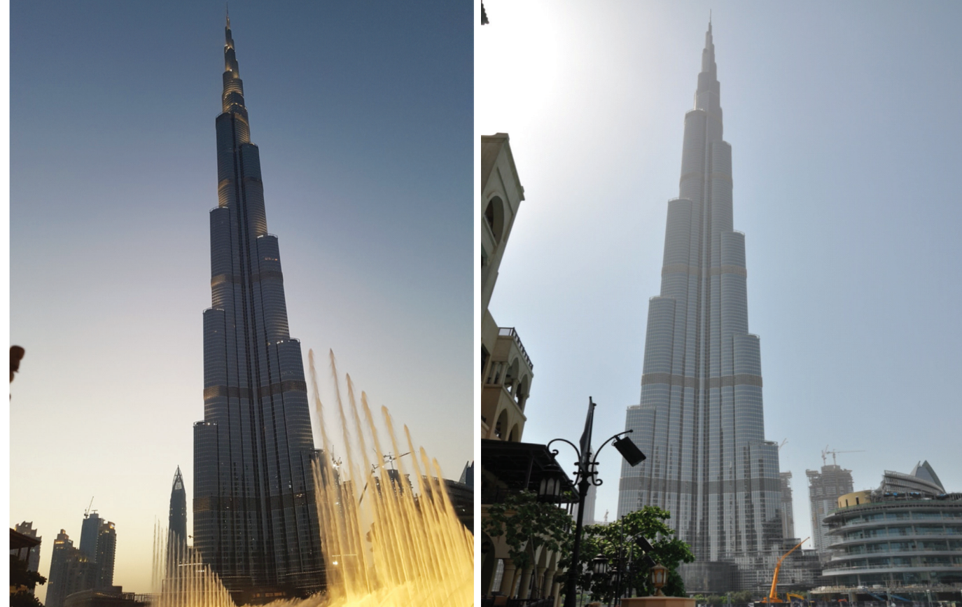
Il. 1 Budynek Burj Khalifa. Na pierwszym planie: słynne Tańczące Fontanny. Burj Khalifa, with the famous Dancing Fountains in the foreground.

The high requirements as regards the building's technological quality and high standard, quality of the space of life and work have all been met by the world's tallest building named Burj Khalifa, erected in Dubai. Since 2009, with a height of 828 metres, it has been the tallest building in the world. The tower features 160 useable storeys, the total number of storeys (including auxiliary space) being 206. The Burj Khalifa's spire is visible from a distance up to 95 kilometres. The tower crosses several climatic zones; the temperature at the building's peak is lower by 10°C, on average, than the one on the ground. Burj Khalifa can be termed a smart build-