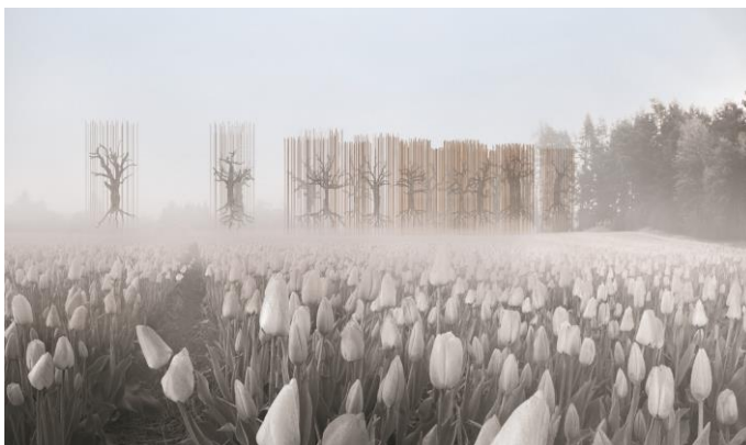
Fig. 6. Memorial Site of polish insurgents massacre from the January Uprising 1863 in the village of Choroszcz. Author diploma project: H. Wojdakowska. Promoter: S. Wojtkiewicz

Fig. 5. Memorial of the former German Nazi death camp at Sobibor. Author diploma project: D. Konopka. Promoter: S.Wojtkiewicz