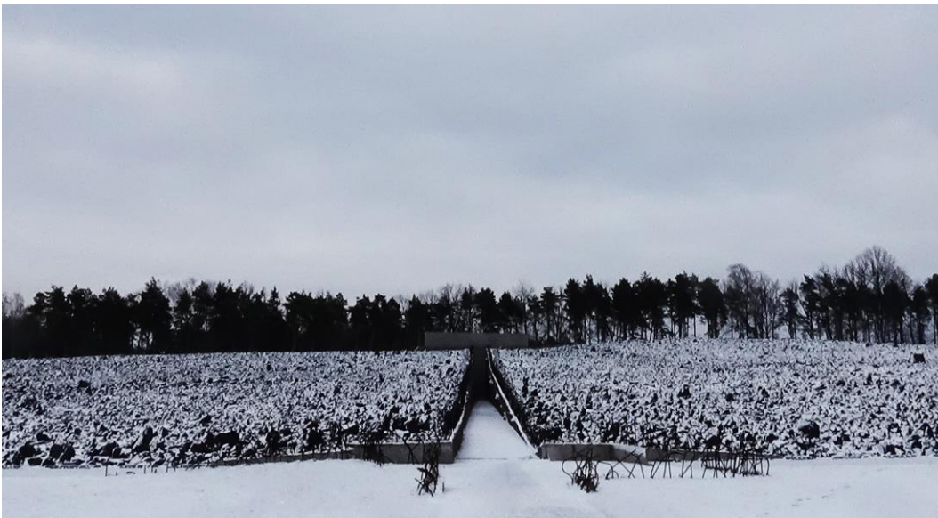
Fig. 1. Memorial of the former Nazi German death camp in Belzec. Author of the project: architects DDJM from Krakow.

to express the same designed space of the spatial form. Symbol releases, opens the realm of reality, transforming the project in the form of space-time. Symbol, therefore, acquires the characteristics of the universe - a category which, within the need to recall the memory seem to be an essential method of achieving it [2, p.12]. Characteristics of the symbol are, therefore, its ability to go beyond their own identity [2, p.19]. The symbol is a category of art, it is also part of a physical expression processing specific information about the characteristics presented the reality of space and its history. This information has different properties occur among the mystical configuration. In this case, semiotic constraints are the material of the form of expressing spiritual perception. Examples of realization of the monument in Belzec (fig.1, 2) show interesting transformations and conversions.