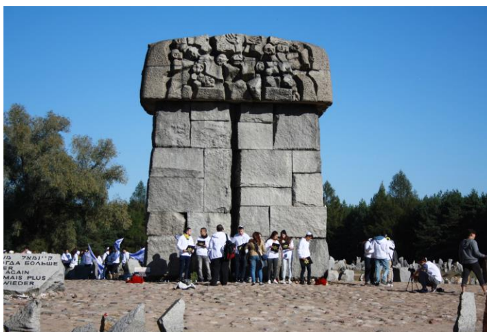
Fig. 4. Memorial of the former German Nazi death camp in Treblinka. Designer: Franciszek Duszeńko.

Ryc. 3. Miejsce Pamięci byłego niemieckiego, nazistowskiego obozu zagłady w Treblince. Autor projektu: Franciszek Duszeńko.