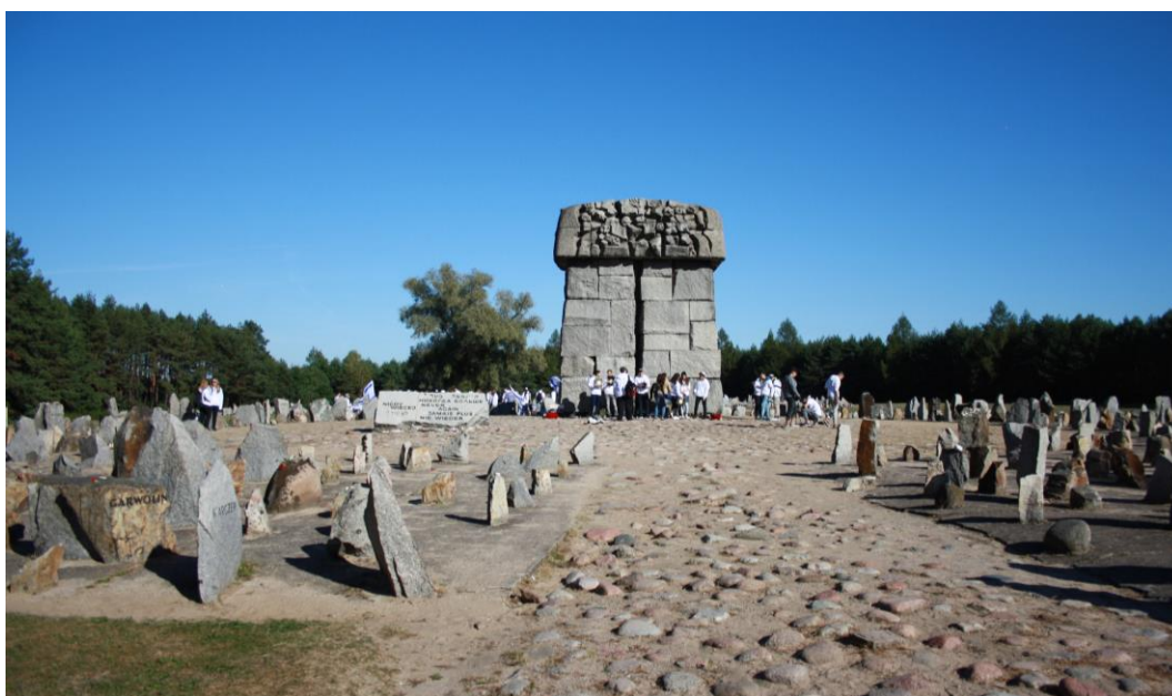
Fig. 3. Memorial of the former German Nazi death camp in Treblinka. Designer: Franciszek Duszeńko. Source: photo. S.Wojtkiewicz 2016

In this way, is achieved the immaterial reality. Recall that reality in the act of art design, impact art predisposes symbol to the rank of sanctity and worship. Symbol sets sacred place. Thus, his desire is directed towards an act of transformation in the space of the image or sign. Fulfills this action arising when the architectural reality is transformed and thus justifies the space within the symbol. As noted by Eliade symbolism is an extension of hierophany (...), thanks to the symbols continue the process hierophany (..) [4, p.429]. The famous realization of the memory place in Treblinka (Fig. 3, 4) emphasizes the role of the symbol as the sacred place. Attached illustrations show the moment of prayer of the Jewish community in the monumental architecture space. This particular dialogue between man and the place and its architectural setting is a special example of sanctifying space.