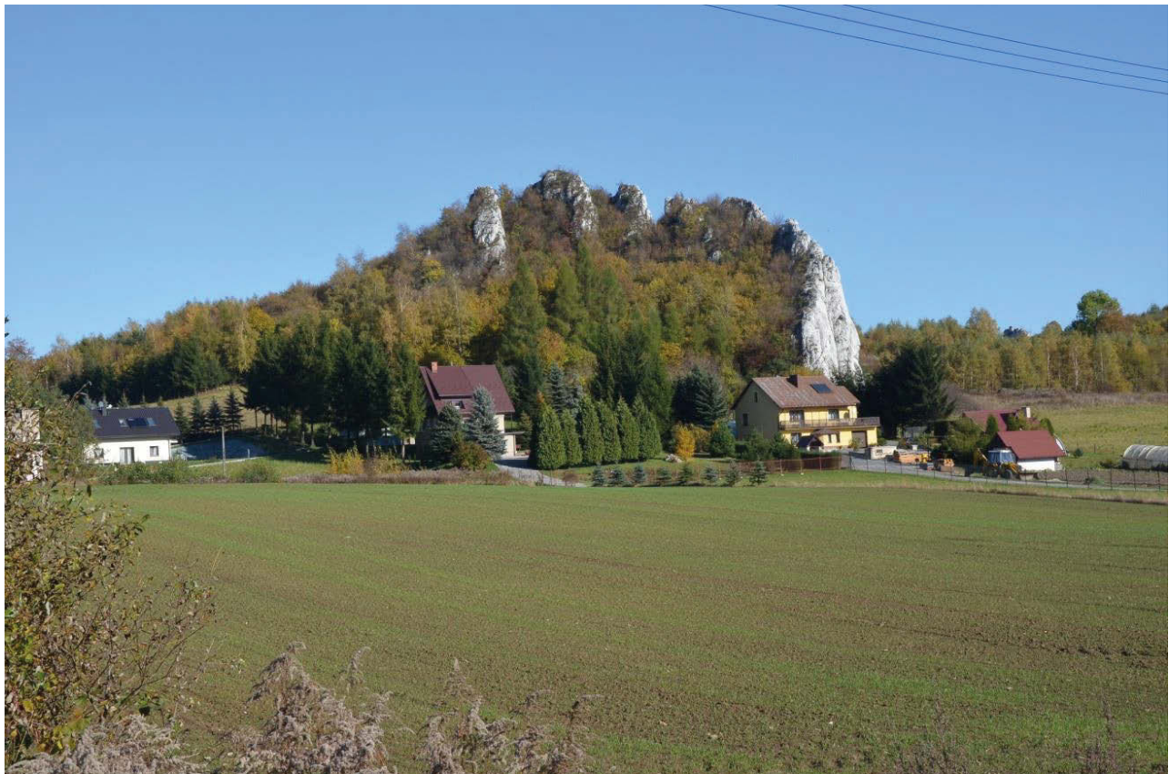
II. 4. Unikalne tereny Jurajskiego Parku Krajobrazowego z charakterystycznymi dla Jury „ostańcami”, zdominowane przez różnego rodzaju formy zabudowy mieszkaniowej.