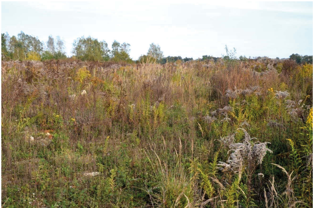
II. 1. Do niedawna uprawiane pola stają się ugorami porośniętymi chwastami.

III. 1. Fields cultivated until recently are becoming fallows overgrown with weeds.