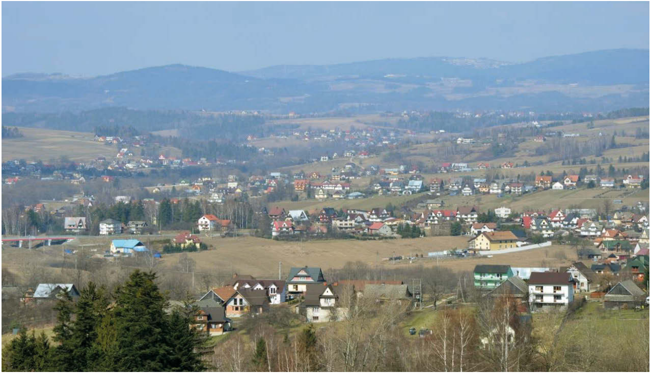
II. 8. Przykład rozproszenia zabudowy wiejskiej w okolicach Chabówki i Rabki na dawnych terenach rolniczych.

III. 8 An example of the dispersion of rural development in the vicinity of Chabówka and Rabka in former agricultural areas.