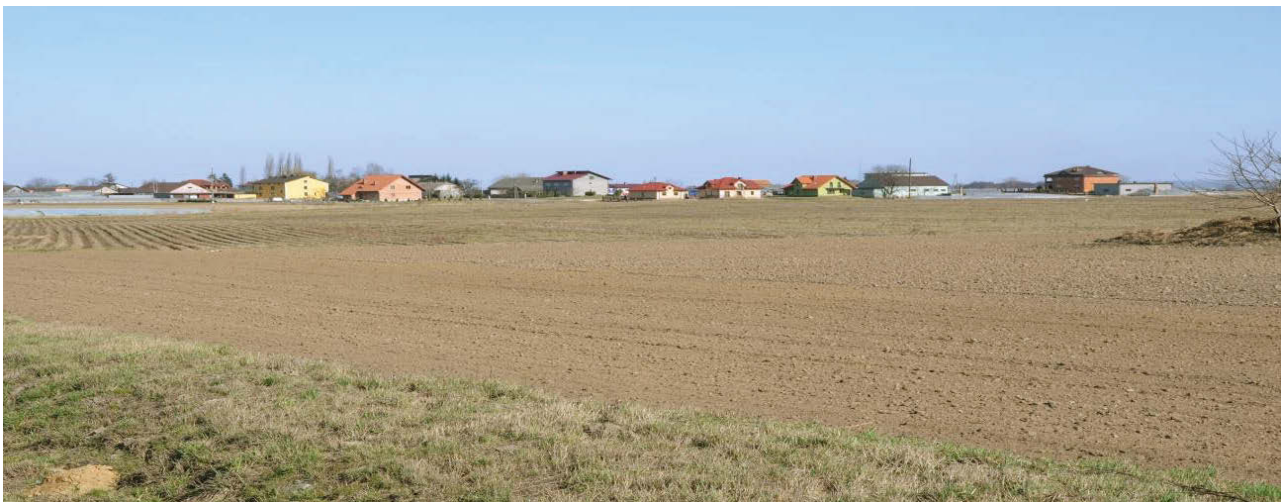
II. 9. Współczesna wiejska zabudowa mieszkaniowa, mniej więcej z tego samego okresu budowy. Poszczególne budynki tworzą niespójny charakter estetyczny, o różnych proporcjach, różnej kubaturze, kolorystyce itp..

III. 8 An example of the dispersion of rural development in the vicinity of Chabówka and Rabka in former agricultural areas.