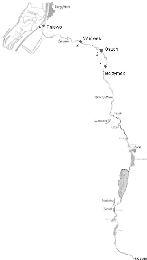
Rys. 1. Rozmieszczenie stanowisk badawczych na rzece Tywa (wykonano na podstawie mapy zamieszczonej przez Keszka i Śmietana 2004)