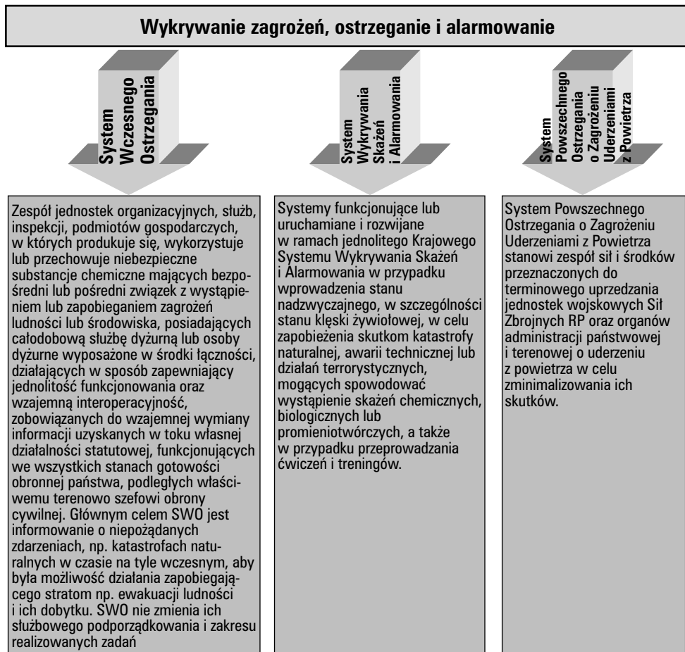
Rys. 1. Schemat wykrywania zagrożeń, ostrzegania i alarmowania

W realizacji zadań z obszaru ochrony życia i zdrowia ludzi oraz mienia i środowiska Obrona Cywilna wykorzystuje szerokie możliwości Systemu Wykrywania i Alarmowania, którego zarys struktury przedstawiono na rys 1.