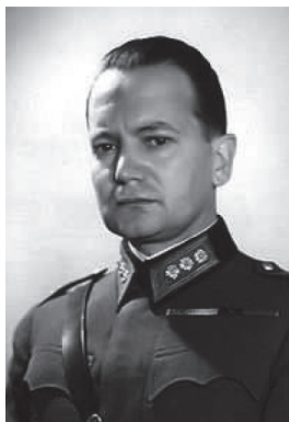
plk Aladár Paasonen, szef fińskiego wywiadu wojskowego w czasie wojny kontynuacyjnej

Ponadto, w ramach tej operacji przewidziano stworzenie, przy pomocy Szwedów, sieci tajnych mobilnych stacji radiowych (radiostacji) w oparciu o własne lekkie konstrukcje radiowe oraz zdobyczny sprzęt radiowy. Ich zadaniem miało być przekazywanie informacji z okupowanej Finlandii do fińskiego kierownictwa wywiadu przebywającego w Szwecji.