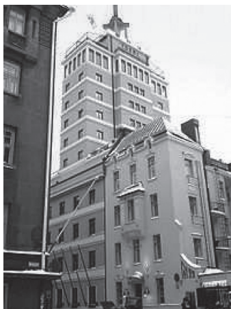
Hotel „Torni” w Helsinkach – siedziba Alianckiej Komisji Kontroli w Finlandii

Tym razem Finowie zorganizowali system przejmowania wiadomości telegraficznych i podsłuchu rozmów telefonicznych prowadzonych przez członków, zdominowanej przez ZSRR, Alianckiej Komisji Kontrolnej, której siedzibą był hotel „ Torni ” w Helsinkach.