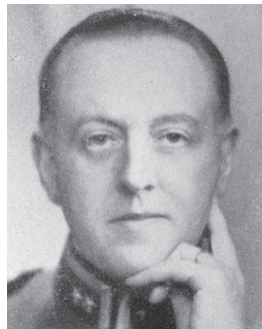
Carl August Ehrensvärd – szef sztabu szwedzkiej armii 8