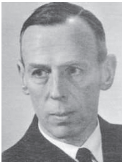
Torgil Thorén – szef szwedzkiego Instytutu Obrony Radiołączności (FRA) 7 (rozpoznanie radiowe)

W operację ewakuacji z zagrożonej przez Armię Czerwoną Finlandii na terytorium Szwecji sprzętu technicznego, personelu oraz aktywów fińskiej służby radiowywiadu i dekryptażu zaangażowani byli najwyżsi przedstawiciele szwedzkich władz wojskowych, w tym m.in. Carl August Ehrensvärd – szef sztabu armii szwedzkiej oraz Torgil Thorén – szef Instytutu Obrony Radiołączności. 6 Prowadzona przez służby wywiadowcze Szwecji i Finlandii operacja stanowiła istotny element tworzenia podstaw szwedzkiej służby rozpoznania radiowego.