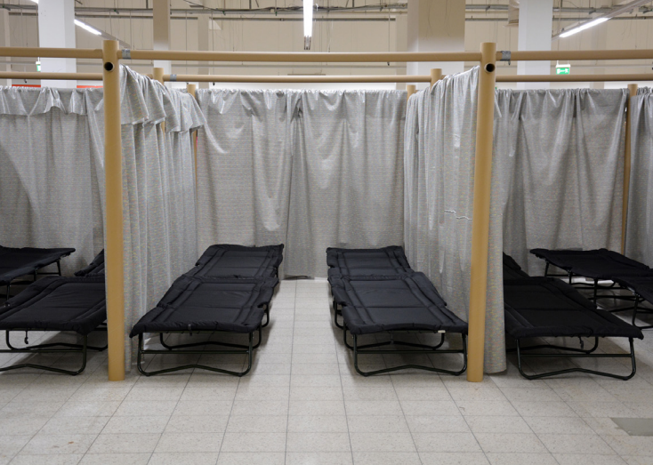
II. 3. Jednostki PPS w byłym Tesco w Chełmie III. 3. PPS units in former Tesco market in Chełm

trwa ok. 20 sekund, a budowa jednego modułu, składającego się z 4 słupów i czterech poprzeczek trwa ok. 4 minut. Modularne rozwiązanie pozwala na budowę jednostek pojedynczych (4 m 2 ), podwójnych lub zwielokrotnionych. Dzięki temu stworzone „pokoje” mogą być dostosowane do wielkości rodziny lub grupy osób, które będą z nich korzystały. Podstawową rolą projektu jest zapewnienie prywatności oraz poczucia bezpieczeństwa.