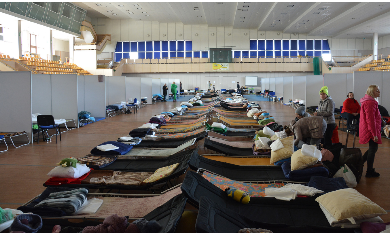
III. 1. Places for refugees at the sport gymnasium in Chełm