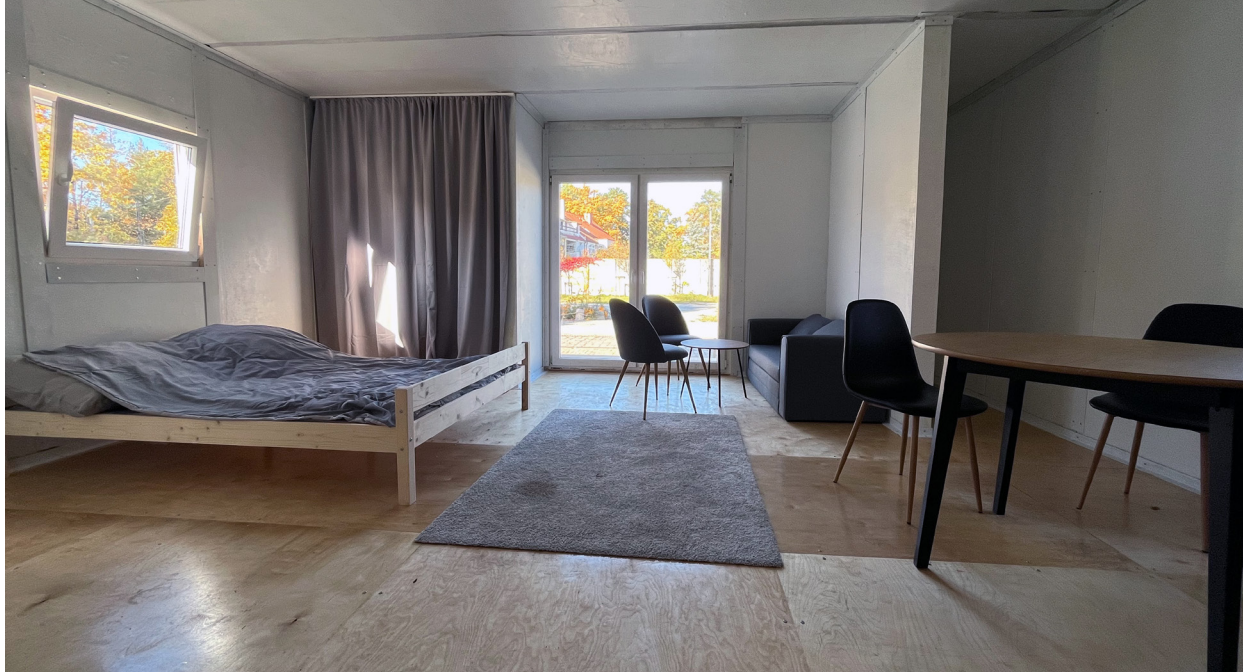
II. 10. Wnętrze jednostki SHS