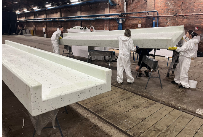
Il. 6. Produkcja paneli podłogowych SHS

Proces budowy prototypu SHS udokumentowany został w postaci filmu: https://www.youtube.com/watch?v=nS6J_09jw7Q