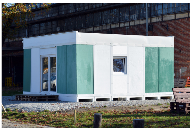
III. 9. SHS prototype in Wrocław, photo Jerzy Łątka