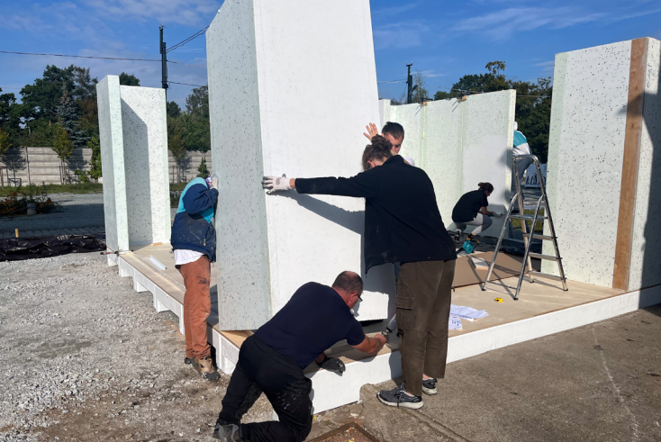
II. 8. Budowa jednostki SHS przez studentów i wolontariuszy