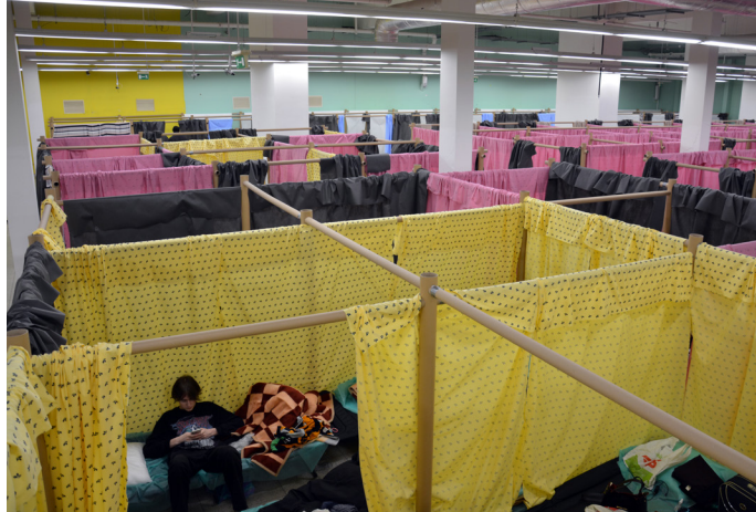
II. 5 PPS w markecie Tesco w Chełmie