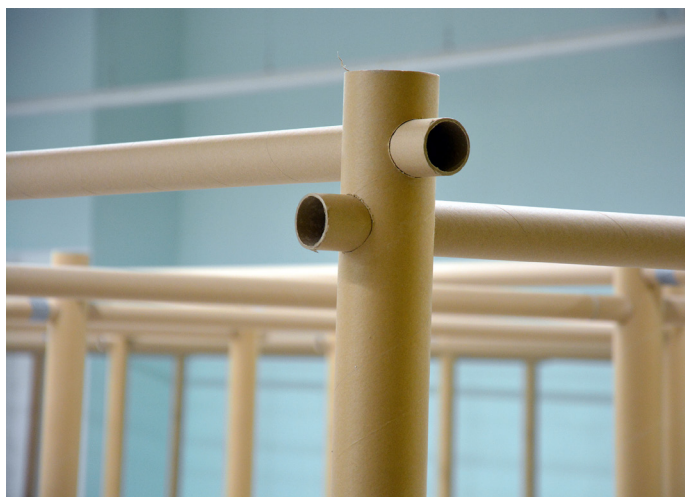
II. 2. Detal – łączenie elementów systemu PPS

Prostota systemu umożliwiła masową produkcję, redukuje koszty i zużycie materiału, pozwala na przetworzenie zużytych tulei w przyszłości. Zastosowana średnica poprzeczek (56 mm) oraz grubość ścianki tulei ok 3 mm pozwala na szybką produkcję poprzez nawiercanie otworów w słupach za pomocą standardowych otwornic o średnicy 57 mm, w które następnie wsuwane są poprzeczki. Poprzeczki łączone są ze sobą za pomocą krótkich (400 mm) tulei – łączników o średnicy zewnętrznej 50 mm, i blokowane na miejscu za pomocą taśmy zbrojonej. Nawiercenie jednego otworu