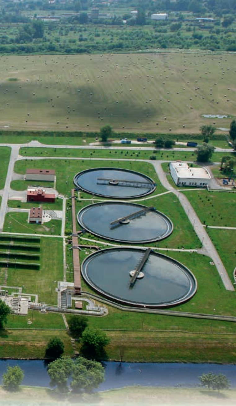
Zakład Oczyszczania Ścieków Płaszów

wyników projektu w działalności gospodarczej. Przekazywane jednostce naukowej dofinansowanie na projekt jest w całości dozwoloną pomocą publiczną dla przedsiębiorcy w rozumieniu regulacji UE, wyliczaną według maksymalnej intensywności wsparcia właściwej dla jego statusu i kategorii prowadzonych badań. Jednostka naukowa może realizować dużo większe projekty dzięki połączeniu środków publicznych i prywatnych oraz wykorzystywać zdobytą wiedzę w dalszej działalności naukowej i dydaktycznej, zachowując prawo do publikacji. Przedsiębiorca odnosi natomiast korzyść w postaci efektów z wdrożenia wyników badań oraz posiadania 100% praw majątkowych do wyników tych badań.