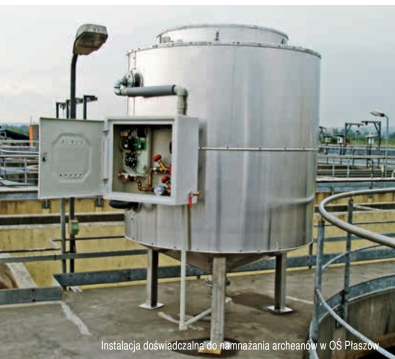
Instalacja doświadczalna do namnażania archeanów w OŚ Płaszów

Zintegrowany system zarządzania ryzykiem i monitorowania korozji w instalacjach wodociągowych będzie pierwszą tego typu innowacją technologiczną w Polsce i najlepszym dowodem na to, że przez podniesienie poziomu innowacyjności i zwiększenie transferu nowoczesnych rozwiązań technologicznych do praktyki przedsiębiorstw wod-kan znacząco rośnie konkurencyjność produktowa i technologiczna na rynku usług wodociągowych.