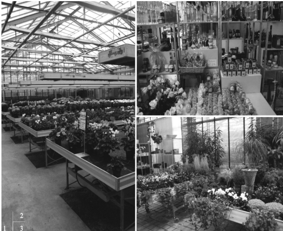
Ryc. 3. Wnętrze sklepu: 1 - szklarnia z kwiatami doniczkowymi, 2, 3 – stoiska z produktami i kwiatami.