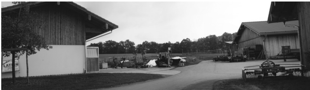
Fot. 1. Widok na podwórze i zabudowania gospodarcze.