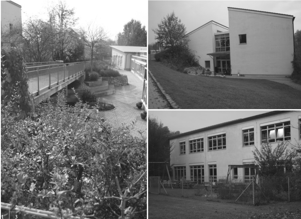
Ryc. 2. 1- Widok na rampę i dziedziniec przy budynku kuchni i jadalni, 2- Wejście do pracowni i warsztatów, 3- Budynek warsztatów wraz z terenem użytkowym poszczególnych pracowni.