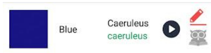
Rys. 2. Przykład braku rozróżnienia zapisu i wymowy

(tʃe'ru.le.us, zgodnie z dwiema zasadami: uproszczeniem dyftongu ae do e oraz wymawianiem c przed e jako (tʃ, nie zaś k ). Syntezator odczytuje jednak wyraz jako ka.e.ru.le.us. , co odpowiada logice kierującej językiem włoskim ( c przed a jako k , brak dyftongów). Ponadto aplikacja nie spełnia zamierzonego zadania w postaci podawania zarówno zapisu, jak i brzmienia wyrazów. Podawanie identycznych form mimo deklaracji o ich rozróżnianiu wprowadza użytkowników w błąd, ponieważ sugeruje ich zbieżność, podczas gdy w wielu przypadkach tak nie jest. Jako przykład może posłużyć wspomniany wcześniej caeruleus (w wymowie restytuowanej kae'ru.le.us , w kościelnej (tʃe'ru.le.us).