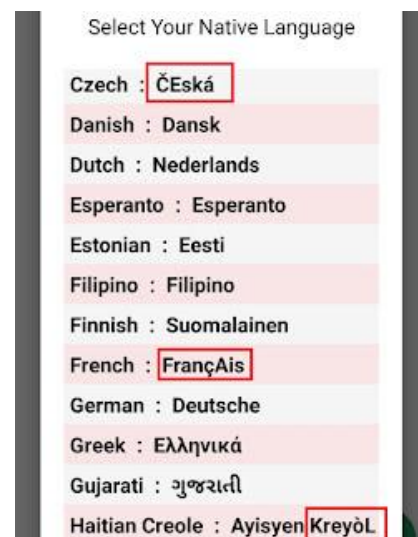
Rys. 1. Przykład problemów ze znakami diakrytycznymi

Pierwszemu uruchomieniu aplikacji może towarzyszyć pewne zdziwienie. Wydawałoby się, że ze względu na swój cel będzie ona perfekcyjnie dopracowana pod względem zapisu. Menu służące do wyboru języka zawiera jednak usterki w postaci błędnie zapisanych nazw ze znakami diakrytycznymi: po literach, które je zawierają, kolejne z nich nieoczekiwanie zwiększają rozmiar. To najpewniej przejaw problemu z kodowaniem. Mimo że jest natury technicznej, a nie filologicznej, nie powinien wystąpić w aplikacji służącej do nauki języka, w której przypadku dokładny zapis jest niezbędny. O ile w większości sytuacji tego rodzaju usterki nie będą przesądzać o efektywności produktu (zapisy nie są mylące, a jedynie nieestetyczne), o tyle bez wątpienia wpływają negatywnie na satysfakcję związaną z jego użytkowaniem.