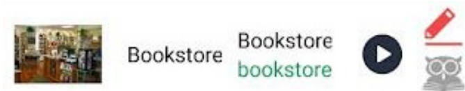
Rys. 4. Przykład brakującego tłumaczenia

Nie stanowi to dużego kłopotu dla osób co najmniej średnio zaawansowanych, ponieważ i tak łatwo im przyjdzie odgadnąć właściwą formę, ale dla początkujących może to być co najmniej mylące, a z pewnością utrudnia naukę. Część słów została też przetłumaczona niedokładnie – tak jest z cash oddanym jako nummum (a więc nie „pieniądze”, a „monetę” – metonimicznie, podano też nie nominativus, ale accusativus). Na marginesie tej kategorii można także wskazać problem w postaci braku przełożenia niektórych wyrazów – np. bookstore w kategorii Town .