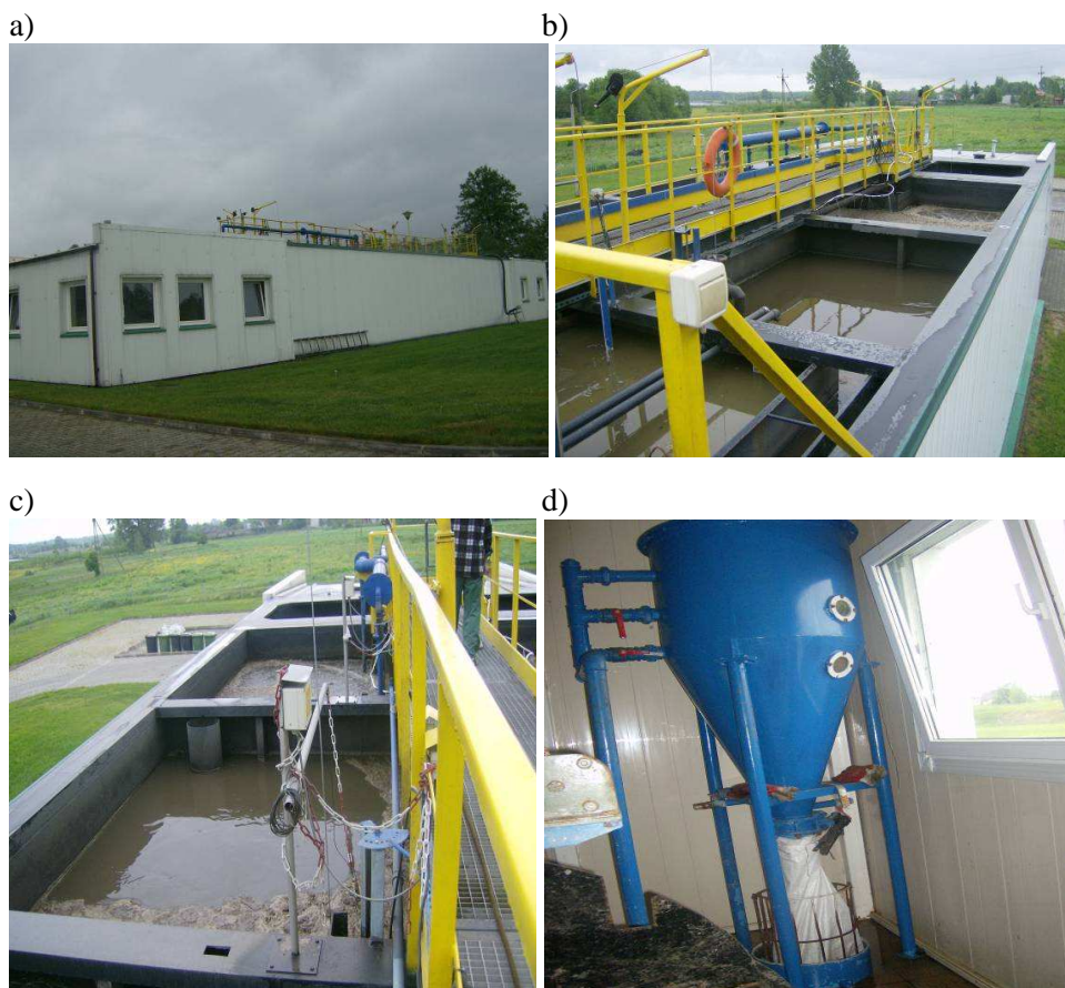
Rys. 3. Oczyszczalnia ścieków w Kodrębie: a) widok ogólny, b) komory nityfikacji i denityfikacji, c) komory napowietrzania, d) separator piasku

Wszystkie odpady z procesów podczyszczania mechanicznego ścieków (piasek, skratki) oraz biologicznego oczyszczania (osad nadmierny odwodniony mechanicznie) są gromadzone na stanowisku składowania osadów odwodnionych, skąd okresowo wywożone są poza oczyszczalnię.