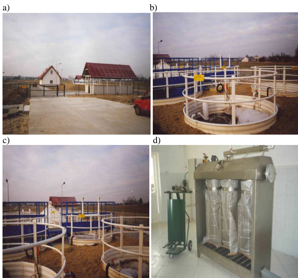
Rys. 1. Oczyszczalnia typu ECOLO-CHIEF: a) widok ogólny oczyszczalni, b) komory napowietrzania, c) komora anoksydacyjna, d) workownica do osadu DRAIMAD

Ilość osadów ustabilizowanych tlenowo i wysuszonych wynosi docelowo 124 \text{ m}^3/\text{rok} . Osady ustabilizowane tlenowo, po zagęszczeniu i odwodnieniu, składowane są w pryzmach na zadaszonym poletku i wywożone okresowo na najbliższe składowisko odpadów stałych.