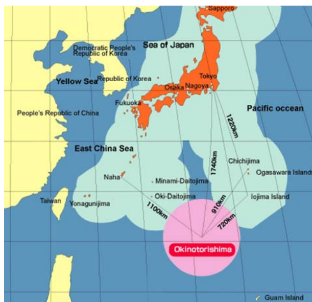
Rys. 1. Położenie atolu Okinotorishima

Już w momencie wyznaczania wyłącznej strefy ekonomicznej oba państwa chińskie (Chińska Republika Ludowa i Tajwan) zgłosiły zastrzeżenia, przedstawiając pogląd, że jest to postępowanie bezprawne, gdyż skały Okinotorishima nie są „wyspami” w rozumieniu konwencji, co jest warunkiem koniecznym uznania ich za podstawę wyznaczenia EEZ. W ten sposób pojawił się spór o charakter skrawków lądu znajdujących się w obrębie atolu. Jeżeli bowiem uznane one zostaną za „wyspy”, zgodnie z art. 121 pkt 2 KoPM Japonii przysługuje prawo wyznaczenia od nich EEZ („morze terytorialne, strefę przyległą, wyłączną strefę ekonomiczną i szelf kontynentalny wyspy określa się zgodnie z postanowieniami niniejszej Konwencji, mającymi zastosowanie do innych obszarów lądowych”) 7 . W przypadku uznania ich za „skały” sytuacja jest zasadniczo odmienna, gdyż pkt 3 wspomnianego artykułu stanowi, iż „skały, które nie nadają się do zamieszkania przez ludzi lub do samodzielnej działalności gospodarczej, nie mają ani wyłącznej strefy ekonomicznej, ani szelfu kontynentalnego”. W 1994 roku ChRL nie rozwijała jednak tego wątku w swoich działaniach politycznych 8 .