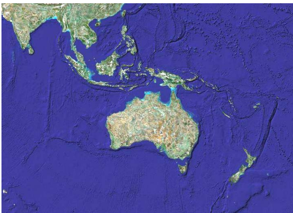
Rys. 1. Australia i inne państwa regionu