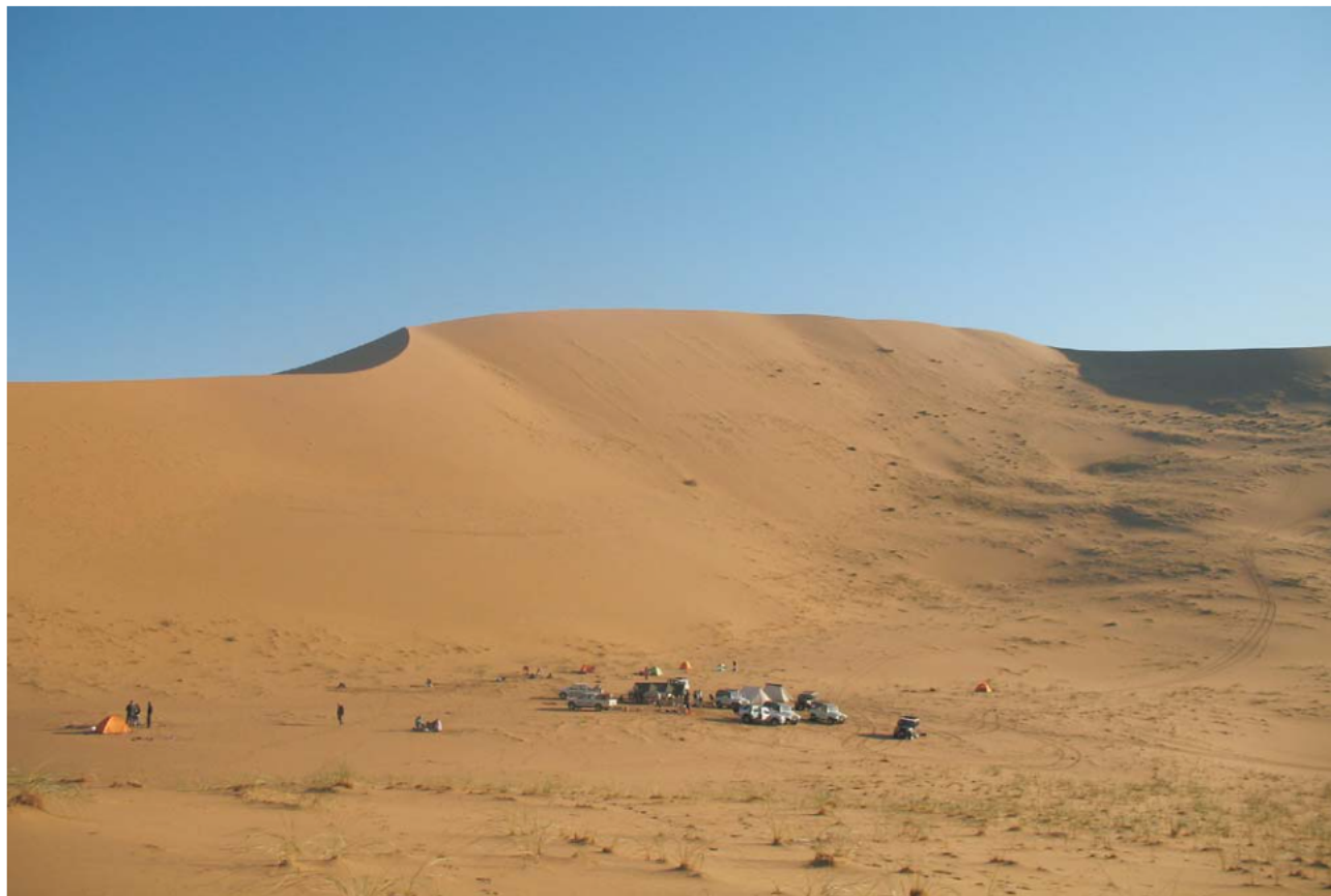
Ryc. 4. Ostra krawędź wydmy na pustyni Badain Jaran w rejonie jeziora Shaobai