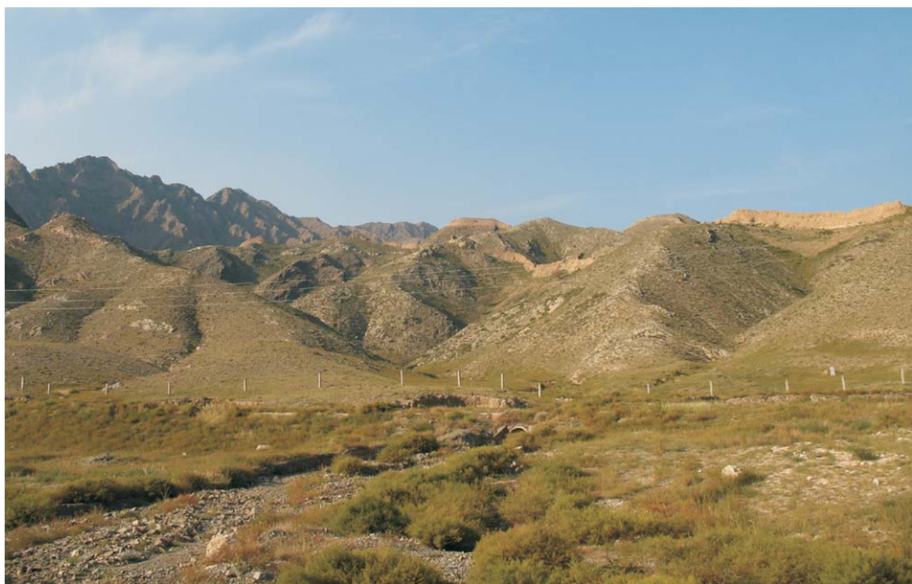
Ryc. 6. Góry Helan (Helan Szan). W prawej górnej części widoczne fragmenty najstarszego muru chińskiego. Obie fot. K. Kenig