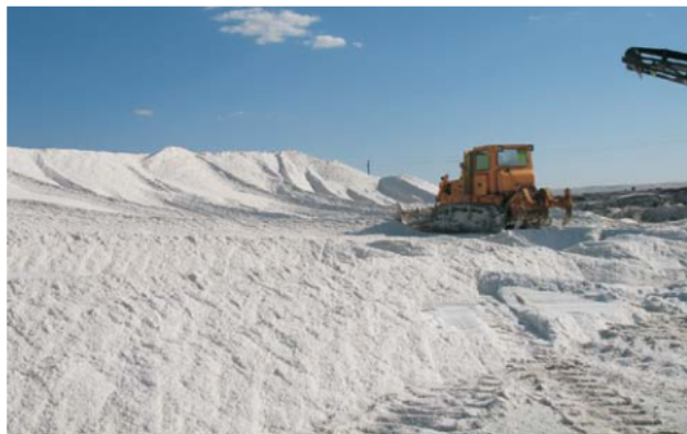
Ryc. 5. Eksploatacja soli koło słonego jeziora Yabulai