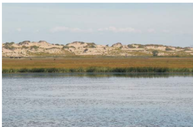
Ryc. 7. Wydmy utrwalone w rejonie obszaru piaszczystego Hunshandake