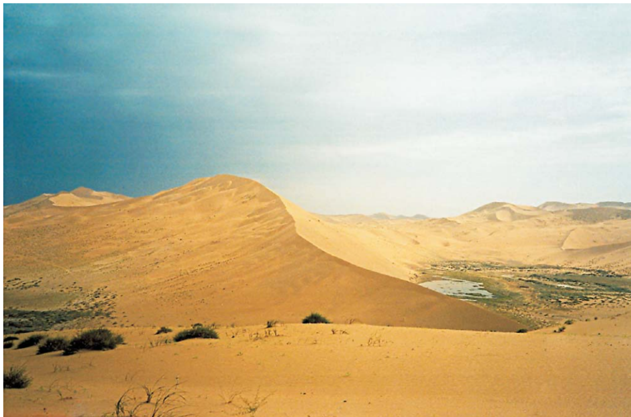
Ryc. 2. Pole wydmore na pustyni Badain Jaran