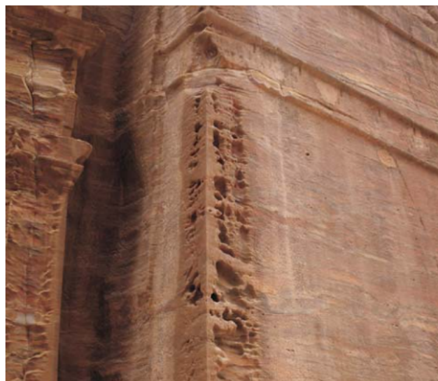
Ryc. 7. Grobowiec nr 67. Tafoni związane ze strefą zawilgocenia.