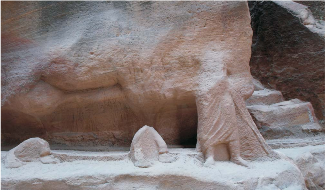
Ryc. 8. Płaskorzeźba karawany w wąwozie wejściowym. W wyniku działania bocznej erozji wodnej podczas deszczów torencjalnych pozostały jedynie zarysy kształtów wielbłąda i przewodnika.