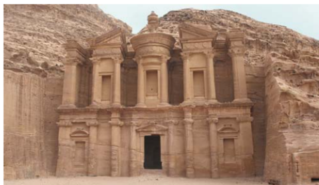
Ryc. 4. Klasztor. Intensywne działanie korazji widoczne jest do wysokości 3 metrów