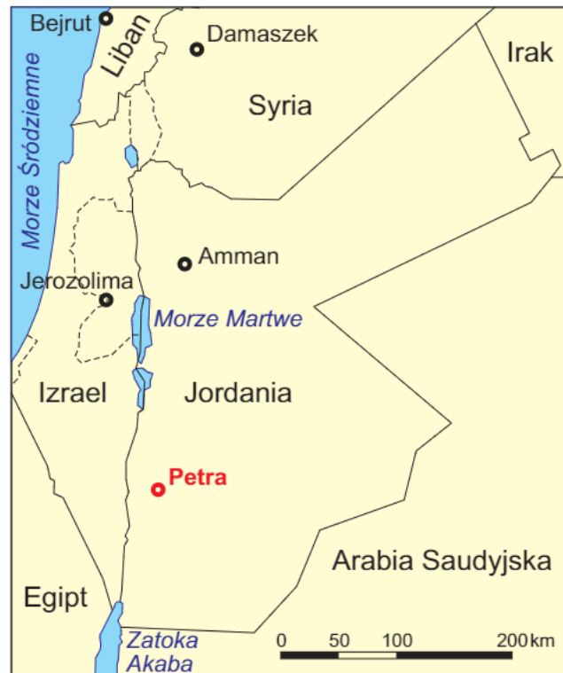
Ryc. 1. Mapa lokalizacyjna

Zmienność parametrów fizycznych skał (średnicy ziaren, porowatości, współczynnika podciągania kapilarnego wody) pomiędzy różnymi warstwami w obrębie jednej budowli skutkuje różnicami w odporności na wietrzenie i powoduje selektywne niszczenie określonych części zabytków. Na to zróżnicowanie nakładają się intensywnie oddziałujące czynniki atmosferyczne, znaczenie ma również kierunek ekspozycji budowli. Wiatry wiejące z zachodu i południowego zachodu przynoszą deszcze, stąd zachodnie i południowe fasady zabytków ulegają intensywniejszemu ich działaniu. Po stronie północnej i wschodniej budowli, w miejscach nie zabezpieczonych przed spływem wody, widoczne są ślady erozji liniowej. Nabatejczycy chronili wykute w piaskowcu budynki, pozostawiając ponad nimi nawisy i tworząc systemy odprowadzania wody. Jednakże wraz z upływem czasu konstrukcje te uległy częściowemu zniszczeniu.