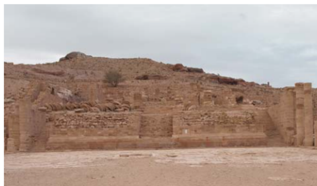
Ryc. 5. Rzymska świątynia. Po lewej stronie widoczne kolumny przewrócone podczas jednego z trzęsień ziemi