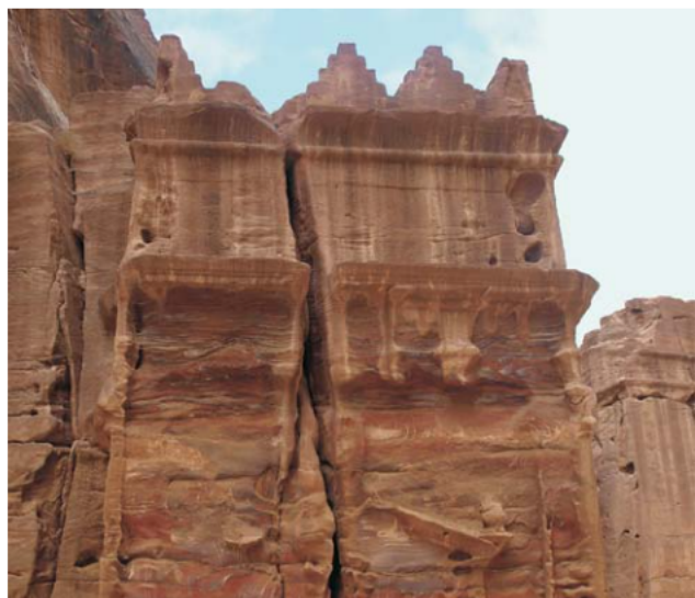
Ryc. 6. Grobowiec nr 70. Efekt zniszczeń spowodowany zmianą kierunków krążenia wód w skale, około 20 lat temu. Widoczny jest dobrze rozwinięty system szczelin