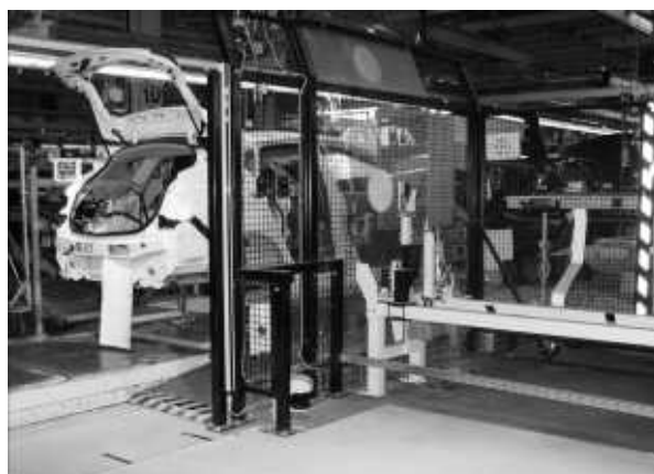
Rys. 1. Stanowisko do montowania deski rozdzielczej w samochodzie – widok ogólny

Przeanalizowano 9 stanowisk, na których zainstalowane były: różnego rodzaju osłony, promienie świetlne, kurtyny świetlne, skanery laserowe oraz maty, podłogi, linki i drążki czułe na nacisk. Analizy miały na celu określenie i weryfikację zasad określania harmonogramów i zakresów kontroli urządzeń ochronnych i osłon. Poniżej przedstawiono przykład jednego ze stanowisk. Jest to stanowisko do montowania deski rozdzielczej w samochodzie.