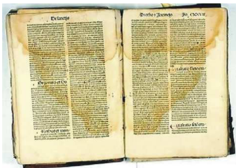
Rys. 1. Zniszczenia w książkach, spowodowane przez zawilgocenia i rozwój mikroorganizmów.

Przy podwyższonej wilgotności najbardziej narażone są odsłonięte grzbiety i brzegi kart; wilgoć wnikając w głąb książki bardzo powoli z niej uchodzi, ponieważ celuloza zawarta w papierze jest materiałem bardzo higroskopijnym. Jeśli nastąpi znaczne zawilgocenie, to wewnątrz książki zachodzą głębokie zniszczenia wywołane rozpułchnieniem klejów w oprawach czy przenikaniem barwników z opraw i ilustracji na sąsiednie karty, co tworzy odbicia i stwarza warunki do rozwoju pleśni, okładki deformują się i odstają. Wilgotny papier, klej, skórę, płótno atakują mikroorganizmy takie jak bakterie, pleśnie [1].