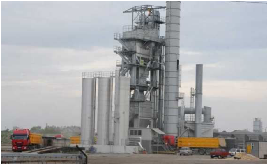
Rys. 3. Zdjęcie otaczarni do produkcji mieszanki bitumicznej w Strzelcach Opolskich.

godzin), skąd jest załadowywana na odpowiednie samochody ciężarowe i odwożona do miejsca wbudowania. Typową otaczarnię do produkcji mieszanki bitumicznej przedstawiono na rys. 3.