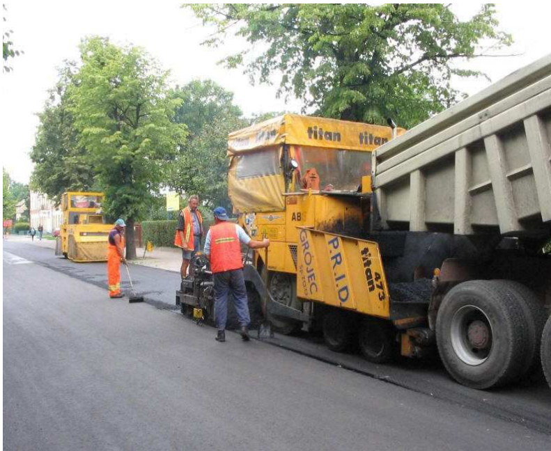
Rys. 4. Prace przy rozkładaniu mas bitumicznych.

W procesie wykonania warstw nawierzchni asfaltowych wykorzystywane są następujące maszyny: wytwórnia mas bitumicznych (otaczarka) o mieszaniu cyklicznym lub ciągłym do wytwarzania mieszanek mineralno-asfaltowych, rozkładarka mas bitumicznych do układania mieszanek mineralno-asfaltowych typu zagęszczanego z elektronicznym sterowaniem, podgrzewaną płytą wibracyjną do wstępnego zagęszczania, walce lekkie, średnie i ciężkie stalowe gładkie, walce ogumione, samochody samowładowcze z przykryciem brezentowym, skrapiaarki.