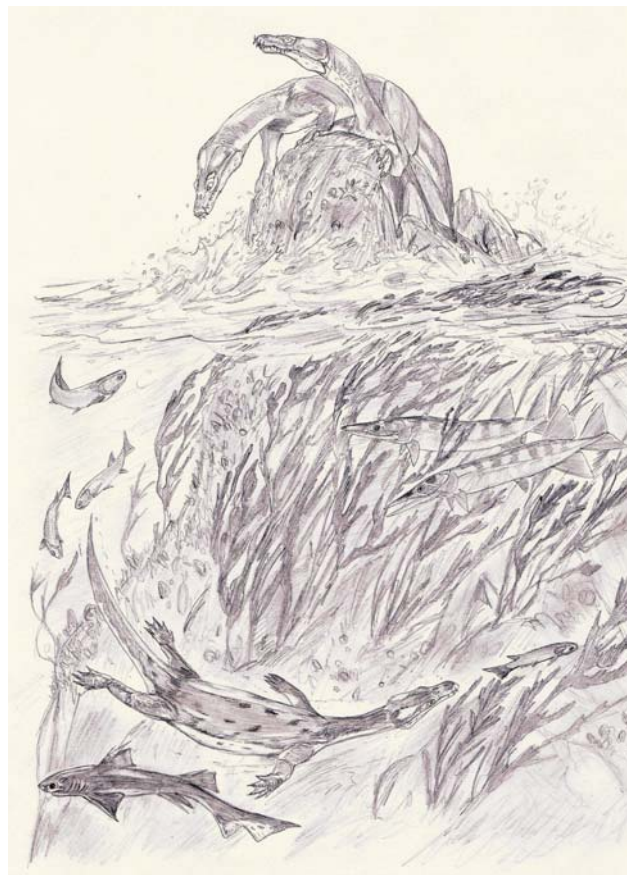
Ryc. 4. Rekonstrukcja środkowo- do późnoladyńskiego marginalnomorskiego ekosystemu z rejonu Miedar. W wodzie i na skałach polujące na ryby notozauiry. Rys. Jakub Kowalski Fig. 4. Reconstruction of the middle-late Ladinian marginal-marine ecosystem from Miedary area. In the water and on rocks nothosaurid reptiles hunting for fish. Drawing by Jakub Kowalski

Zespół fauny kręgowców rozpoznany z warstw miedarskich zawiera szczątki zarówno morskich, jak i lądowych zwierząt. Stanowi zapewne nagromadzenie kości z dwóch sąsiadujących ze sobą biotopów – środowiska marginalnomorskiego oraz lądowego (ryc. 4). Zapis tego typu zespołów jest unikalny i wart dalszych analiz i kolejnych badań. Może to być szczególnie istotne w dokładnym rozpoznaniu skali i tempa wymiany faunistycznej związanej ze zmianami środowiskowymi (tzn. siedliskowymi). Rozpoznany zespół można korelować z fauną dolnego kajpru Lettenkohlenformation z obszaru południowych Niemiec oraz fauną z tzw. brekcji (warstw) kościonośnych najwyższego wapienia muszłowego z obszaru Niemiec i Holandii. W stanowisku paleontologicznym w Miedarach, przy współpracy badaczy z Polskiej Akademii Nauk, Uniwersytetu Warszawskiego i Uniwersytetu Wrocławskiego, przeprowadzone będą dalsze badania geologiczne oraz prace wykopaliskowe.