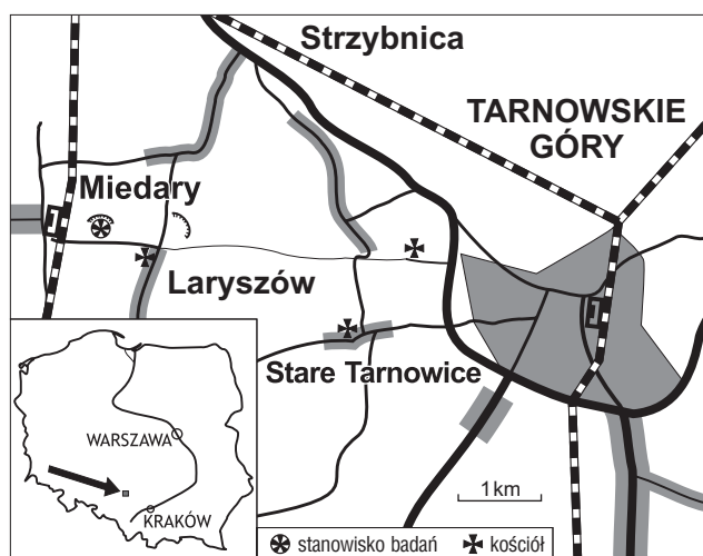
Ryc. 1. Lokalizacja stanowiska w Miedarach na Górnym Śląsku Fig. 1. Location of Miedary site in the Upper Silesia

niec IG 1, Solarnia IG 1) warstwy z Miedar mają miąższość znacznie mniejszą, ok. 12–18 m (Kotlicki & Siewniak-Madej, 1982; Siewniak-Madej, 1982).