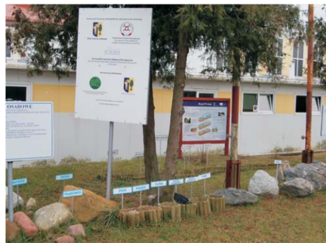
Ryc. 2. GeoTrop w lapidarium petrograficznym przy szkole podstawowej w Jonkowie (województwo warmińsko-mazurskie).

Fig. 1. GeoTrop leaflets displayed at the Polish Geological Institute – National Research Institute stand during the Tour Salon International Touristic Fair (20–23 October 2010, Poznań).