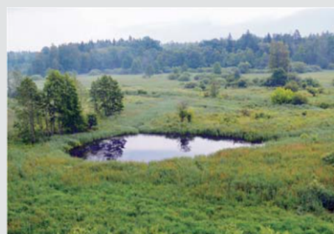
Widok z wieży w Kosym Moście

stoi wysoka wieża widokowa. Z platformy rozciąga się szeroki widok na dolinę rzeki Narewki. W tym rejonie dolina jest wcięta na niewielką głębokość, zajmuje płaski obszar dawnego obniżenia wytopiskowego po dużej bryle martwego lodu (5,0×2,5 km). Powierzchnię tego fragmentu doliny stanowi równina akumulacji torfowej, która jest zarazem powierzchnią tarasu zalewowego. Torfy o miąższości do 2 m przykrywają osady rzeczne – piaski i namuły. Dolinki mniejszych rzek, jak nieopodal uchodzące do Narewki Hwoźna i Przedzielna, mają na ogół brzozy niskie i pokryte są torfami lub namułami.