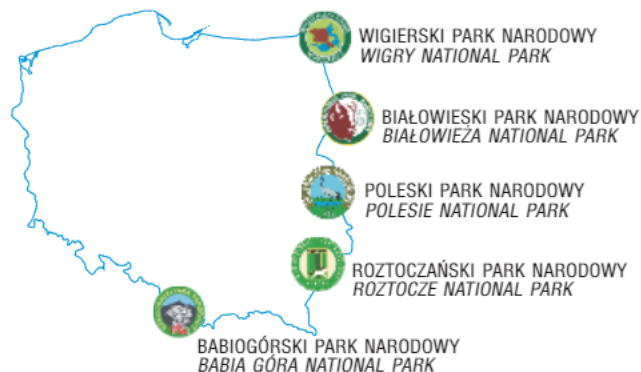
Ryc. 1. Lokalizacja parków narodowych, dla których wykonano mapy geologiczno-turystyczne

Parki narodowe to obszary o niepodważalnych walorach przyrodniczych i naukowych. Z uwagi na ich zalety turystyczne powstała potrzeba przygotowania syntetycznego i przejrzystego wizualnie opracowania, które będzie atrakcyjne zarówno dla przeciętnego, jak i wymagającego odbiorcy. Takie warunki spełniają wykonane w połowie 2010 r. w Państwowym Instytucie Geologicznym – Państwowym Instytucie Badawczym mapy geologiczno-turystyczne pięciu parków narodowych (ryc. 1 i 2): Babiogórskiego (Wójcik i in., 2010), Białowieskiego (Krzywicki & Pielach, 2010), Poleskiego (Kucharska & Danel, 2010), Roztoczańskiego (Krapiec i in., 2010) i Wigierskiego (Rychel i in., 2010). Mapy zostały wykonane na zamówienie ministra środowiska i sfinansowane ze środków Narodowego Funduszu Ochrony Środowiska i Gospodarki Wodnej. Stanowią one bardzo ważny element popularyzacji geoturystyki.