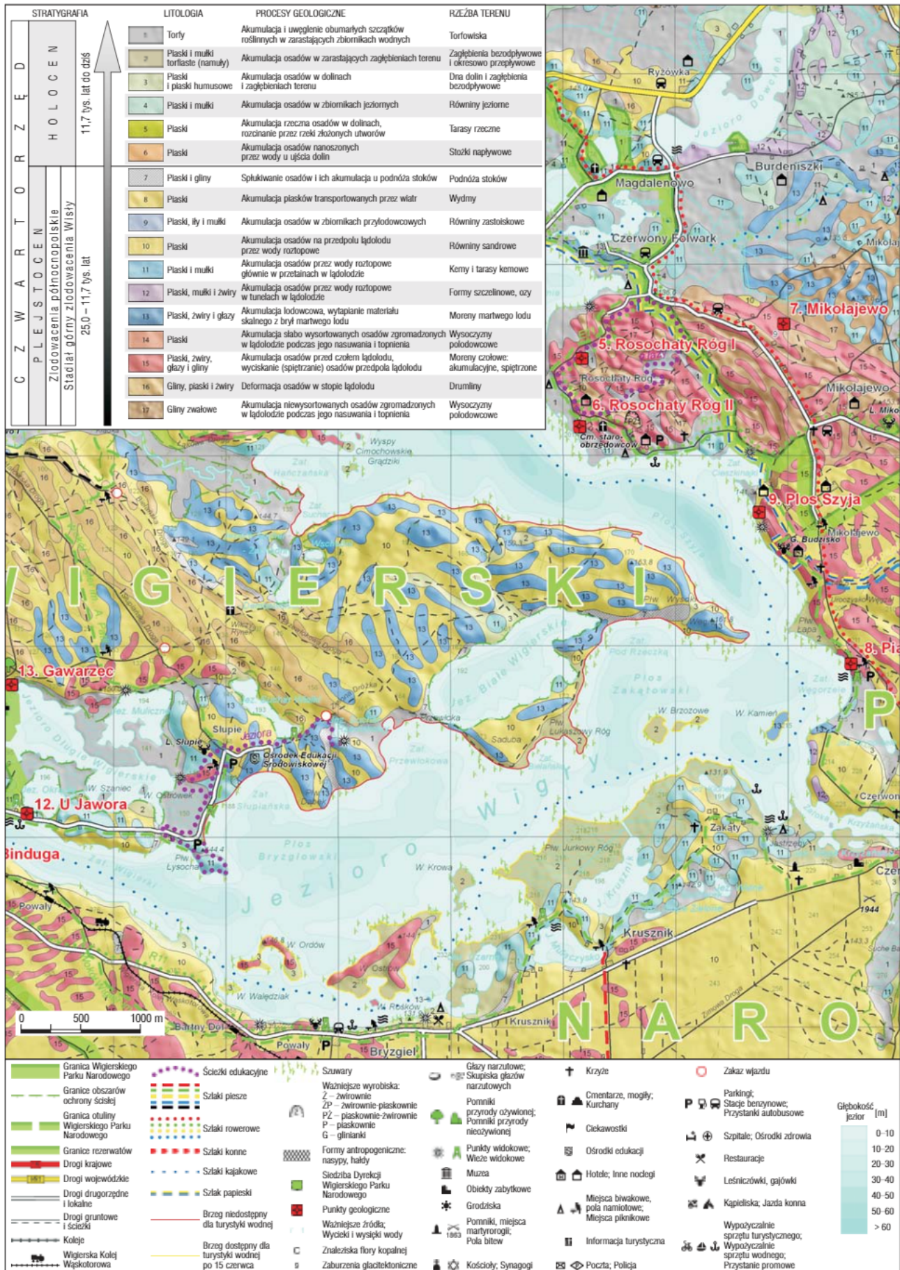
Ryc. 3. Przykładowy fragment mapy geologiczno-turystycznej Wigierskiego Parku Narodowego (opracowanie cyfrowe: E. Piotrowska, A. Tekielska i J. Przasnyska)