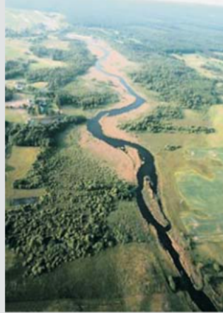
Widok na dolinę Czarnej Hańczy

Rzeka Czarna Hańcza na odcinku od Sobolewa aż do ujścia w Jeziorze Wigry wykorzystuje dolinę zorientowaną z zachodu na wschód. Przez dolinę wiedzie zielony szlak, poprowadzony przez tzw. kładki. Dolina rzeki wypełniona jest torfami o miąższości od 1 do 2 m. Proces zarastania (tworzenia się torfów) rozpoczął się około 3 600 lat temu, czyli w okresie subborealnym. Zarówno południowe jak i północne brzegi doliny są strome, a ich wysokość wynosi około 20 m. Po północnej stronie doliny, stoki oddalone są od rzeki o około 300–400 m. W północnej części doliny, występują żwirowo-piaszczyste pagórki, które zorientowane są z zachodu na wschód, czyli zgodnie z rozciągłością doliny. Schemat powstania tego odcinka doliny Czarnej Hańczy przedstawiono na rysunku 15. Pierwotnie była to rynna lodowcowa o kierunku z północnego zachodu na południowy wschód. Potem w czasie deglacjacji całego obszaru zalegały w niej bryły martwego lodu (do wysokości 150 m n.p.m.), czyli nieco wyżej niż w punkcie 13. W strefie kontaktu martwego lodu i stoków rynny osadzały się piaski i żwiry tworząc wąskie tarasy kemowe. Na powierzchni terenu ponad rynną lodowcową i ponad zalegającym w niej martwym lodem, wody lodowcowe osadzały piaski sandrowe.