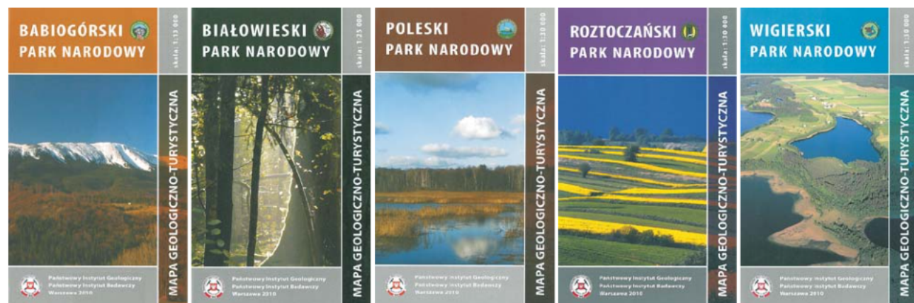
Ryc. 2. Okładki map geologiczno-turystycznych parków narodowych wykonanych w PIG-PIB w 2010 r.