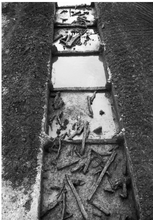
Fot. 1. Zdjęcie lotnicze grodziska w Wolsku

Z racji swej wąskiej specjalizacji gospodarczej, społeczności cyklu wstęgowego niezmiennie zajmowały obszary o ciężkich, żyznych glebach. Siłą więc rzeczy nie stworzyły na omawianym obszarze gęstej sieci osadniczej. Niemniej jednak w oparciu o liczne