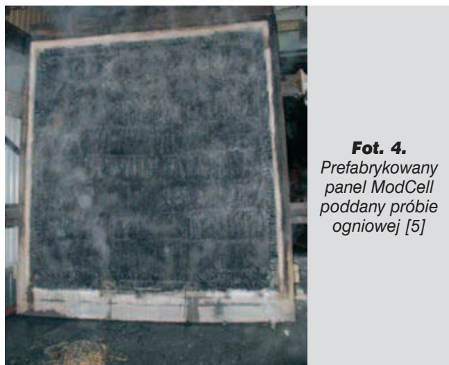
Fot. 4. Prefabrykowany panel ModCell poddany próbie ogniowej [5]

w ten sposób praktycznie bezpowietrzne środowisko, co zapewnia bardzo dobrą odporność ogniową. Panele ModCell posiadają certyfikat odporności ogniowej na 2 godziny, co dwukrotnie przekracza wymagania brytyjskiego prawa budowlanego. W laboratoriach Uniwersytetu w Bath prefabrykowany panel poddany został przez 2 godziny i 15 minut próbie ogniowej o temperaturze powyżej 1000°C. Zniszczenie tynku wapiennego przykrywającego panel nastąpiło po 90 minutach. Odstońnięte baloty słomy były wystawione na działanie ognia przez kolejne 45 minut, czego rezultatem było zwęglenie słomy [5].