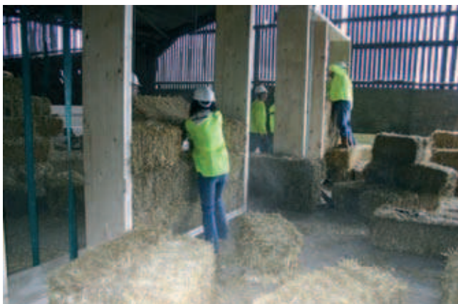
Fot. 1. Wypełnianie prefabrykowanych paneli ModCell balotami słomy [4]