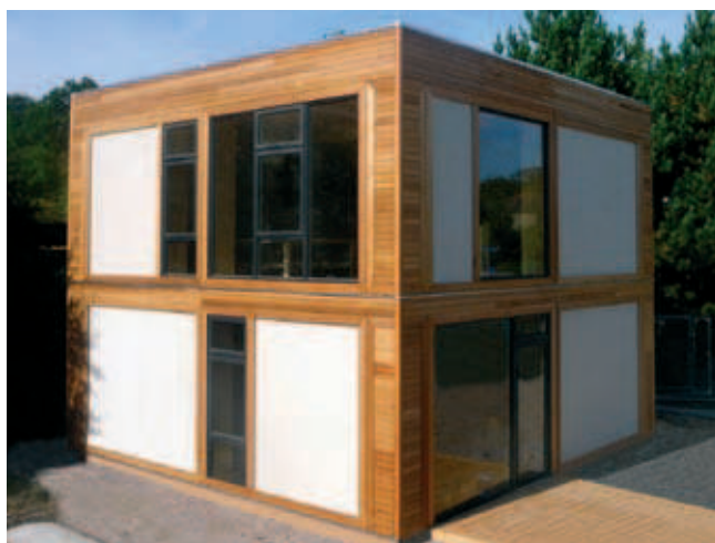
Fot. 6. Eksperymentalny budynek BaleHaus na kampusie uniwersyteckim w Bath [4]

Zespół badawczy Centrum Badań i Rozwoju Innowacyjnych Materiałów Budowlanych (BRE) prowadził