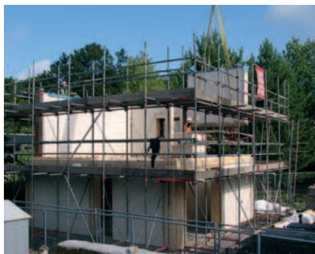
Fot. 3. Montaż prefabrykowanych paneli na budowie [5]

Biorąc pod uwagę zjawisko sekwestracji, zawartość dwutlenku węgla w panelach ModCell jest wręcz negatywna. Typowy panel ModCell o wymiarach 3 x 3,2 m to równowartość 1400 kg z atmosferycznego CO 2 zamkniętego w słomie i drewnie. Eksperymentalny dwupiętrowy budynek BaleHaus posiada 34 tony dwutlenku węgla „uwięzione” w materiałach budowlanych.