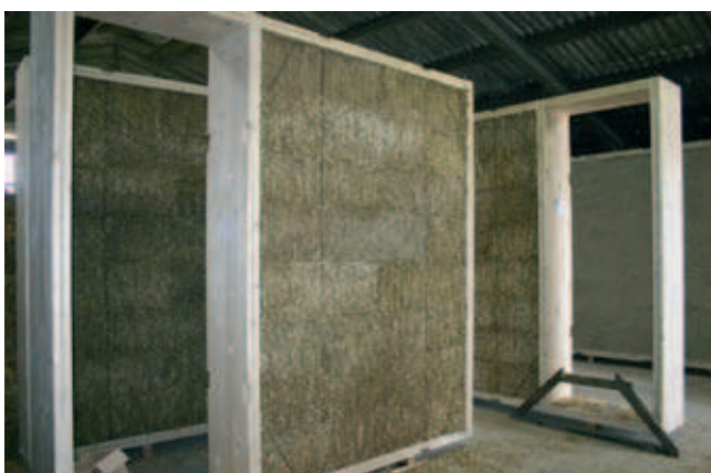
Fot. 2. Prefabrykowane panele ModCell wypełnione balotami słomy [4]

le przekrywane są trzema warstwami tynku wapiennego i dostarczane na budowę.