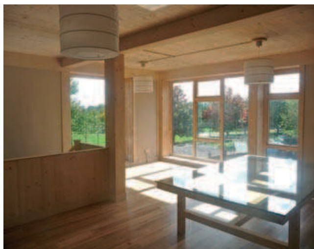
Fot. 7. Wnętrze eksperymentalnego budynku BaleHaus [4]

2-letni monitoring budynku. Szczegółowym badaniom poddana została izolacyjność termiczna przegród, wydajność energetyczna budynku i wilgotność słomy ukrytej w prefabrykowanych panelach ściennych. Wewnątrz paneli zainstalowano 66 bezprzewodowych czujników rejestrujących poziom wilgotności względnej i temperatury, kolejnych 9 czujników monitorowało warunki w połączeniach płyt. Dodatkowych 12 czujników bezprzewodowych zamontowanych zostało wewnątrz domu. Zebrane dane posłużyły do opracowania charakterystyki energetycznej obiektu [7].