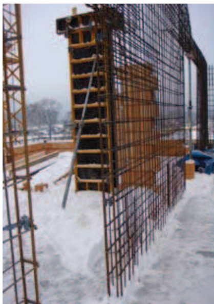
Rys. 3. Widok placu budowy w okresie zimowym w Gdańsku

nie metody elektronagrzewu – jako dodatkowego zabezpieczenia prawidłowego wiązania, twardnienia i dojrzewania betonu. W tym celu użyto grzałek, mocowanych do zbrojenia w pionie i poziomie za pomocą drutu wiązałkowego lub plastikowych pasków. Odległość pomiędzy grzałkami wynosiła 20 ÷ 35 cm w układzie zarówno pionowym jak i poziomym. Ściany o grubości do 35 cm grzano jednostronnie, zaś grubsze dwustronnie. Jedna grzałka o długości 25 m wystarczała do ogrzania 1 m 3 betonu. Końce grzałki połączono z przewodami zasilającymi poprzez plastikowe złączki, które następnie izolowano, aby woda z betonu nie dostała się do połączeń. Złączki zlokalizowano w odległości około 10 cm od wierzchu betonu. Aby zabezpieczyć położenie grzałek podczas betonowania grzałki pionowe mocowano pod przewodami poziomymi. Szczególną uwagę zwracano na miejsca otworów technologicznych, pilnując, aby grzałki nie przechodziły przez otwory. W przeciwnym razie grzałka nieotulona betonem uległaby natychmiastowemu przepaleniu. Przewody zasilające grzałki (po 12 par) były podłączone do transformatora. Napięcie w grzałkach nie przekraczało 40 V, a każdy obwód był kontrolowany ciągami mierniczymi.