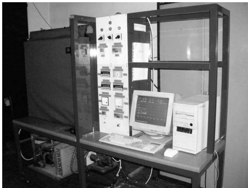
Ryc. 1. Stanowisko do badania współczynnika przenikania ciepła

W Laboratorium Badawczym ISCMOiB, Oddział Szkła w Krakowie prowadzi się badania określenia współczynnika przenikania ciepła U szyb zespolonych przy zastosowaniu metody opisanej w normie PN-EN 674:1999 [2]. Stanowisko, na którym wykonywane są badania przedstawia rycina 1.