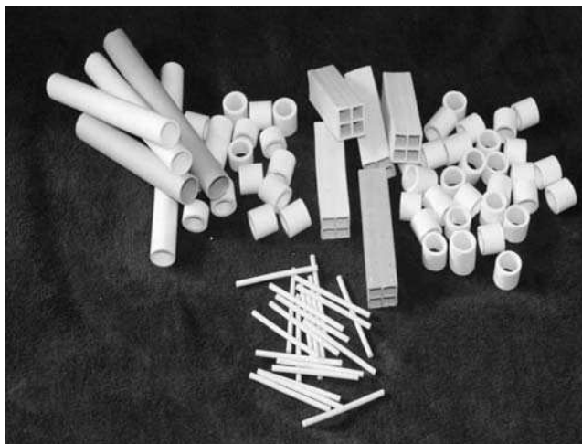
Ryc. 1. Przykładowe wyroby formowane techniką ekstruzji

Ekstruzja jest jedną z częściej stosowanych w ceramice technicznej metod formowania wyrobów. Ograniczeniem tej metody jest możliwość formowania jedynie prostych kształtów (skomplikowanych tylko w jednej płaszczyźnie) tak zwanych profili jednokierunkowych (ryc. 1).