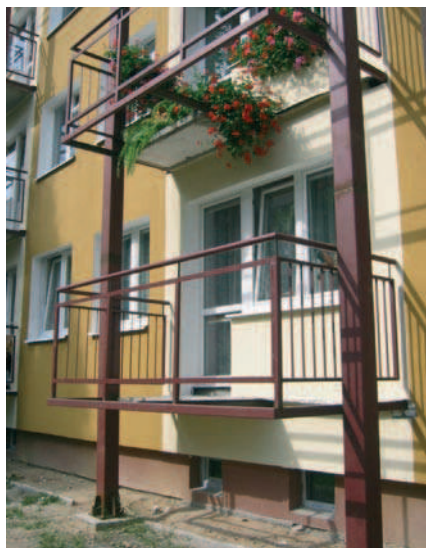
Fot. 7. Lublin, nieodcięty balkon wspornikowy w dostawionym szkielecie stalowym