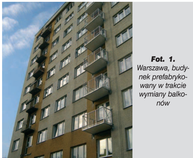
Fot. 1. Warszawa, budynek prefabrykowany w trakcie wymiany balkonów

b) Glifów i narożników ścian . Glify należy docieplić metodą Bezspoinowego Systemu Ocieplenia najlepiej na styropianie ekstrudowanym, a docieplenie narożników ścian półszczytowych można zrealizować dzięki zastosowaniu przeszklonych balkonów dostawianych (Drezno, fot. 3).