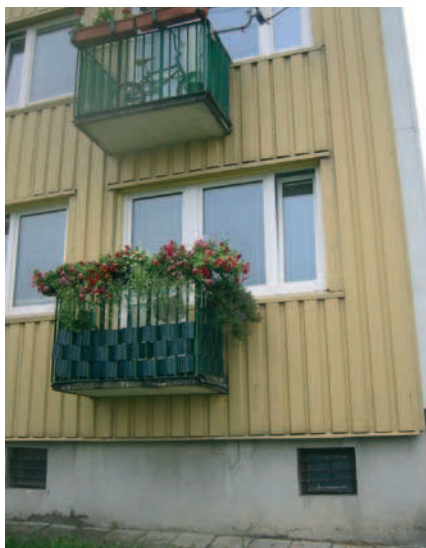
Fot. 6. Lublin, budynek wielkopłytowy, widok balkonu wspornikowego wg katalogu systemowego