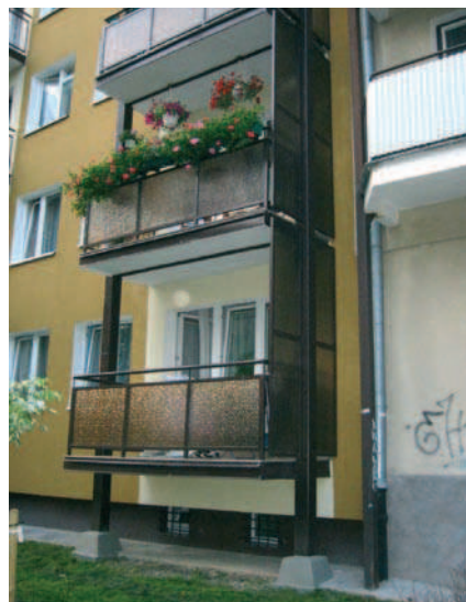
Fot. 8. Lublin, w płycie balkonowej zabetonowano nieodcięty balkon wspornikowy

słonecznych (fot. 5) czy montażu w węzłach pomp ciepła dla potrzeb kilku budynków lub całego osiedla daje optymalne efekty ekonomiczne.