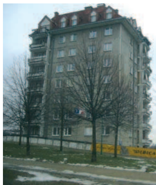
Fot. 9. Czechów, budynek wielkopłytkowy W-70 nadbudowany dachem o konstrukcji drewnianej