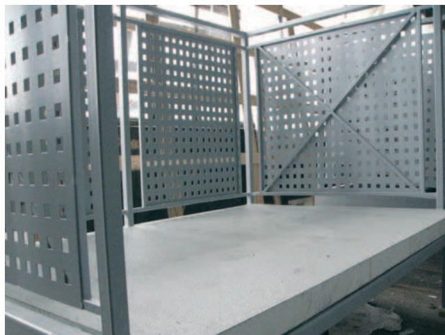
Fot. 2. Balkon podwieszany o konstrukcji stalowej z lekką płytą kompozytową pokrytą dwustronnie blachą aluminiową

a) Balkonów poprzez likwidację pozostawione-