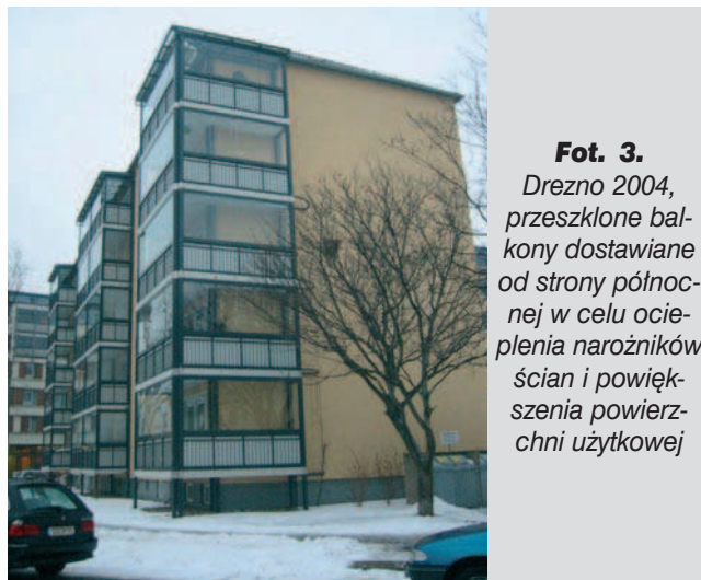
Fot. 3. Drezno 2004, przeszklone balkony dostawiane od strony północnej w celu ocieplenia narożników ścian i powiększenia powierzchni użytkowej