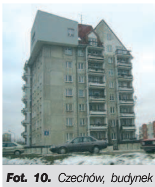
Fot. 10. Czechów, budynek wielkopłytkowy W-70 nadbudowany betonem komórkowym lub cegłą ceramiczną pełną i dachem o konstrukcji drewnianej

budową 21 . Jest ona możliwa dzięki zmianie stropodachu na dach dwuspadowy o konstrukcji drewnianej lub stalowej i adaptacji powstałej przestrzeni na cele mieszkalne. Przykłady takiej nadbudowy znaleźć można w Lublinie. W latach dziewięćdziesiątych XX wieku zrealizowano eksperymentalną inwestycję wskazującą możliwość innego niż dotychczasowe zwieńczenie budynku wielkopłytkowego, poddasze przeznaczono głównie na pracownie plastyczne (fot. 9–10). Nadbudowa pozwala na uzyskanie dodatkowej powierzchni użytkowej przy wykorzystaniu istniejącej infrastruktury i może zapewnić źródło finansowania dla uzgodnionych z mieszkańcami pilnych prac modernizacyjnych, np. wstawienie wind dla osób niepełnosprawnych.