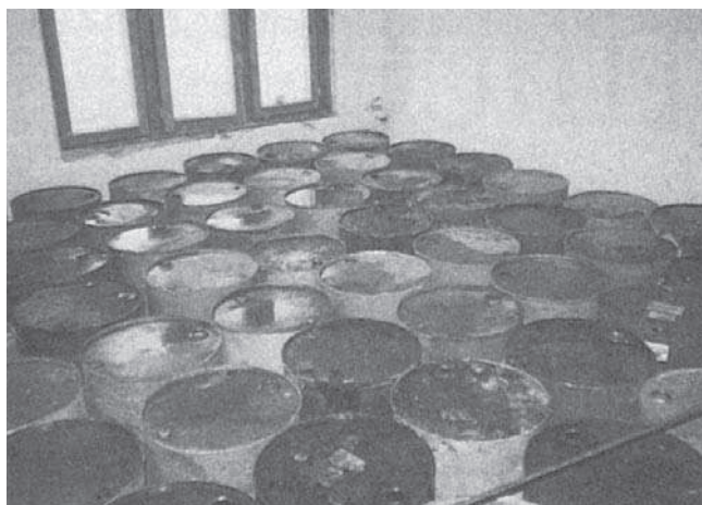
Rys. 1. Beczki z wodą jako obciążenie próbne

Badania konstrukcji budynku za pomocą obciążeń próbnych wykonano obciążając pojedyncze pola stropów. Obciążenia próbne wykonano dla narożnych fragmentów stropów na 6-ciu różnych poziomach budynku. Zastosowano obciążenia próbne o wartości około 3,6 kN/m 2 przyłożone na polach o mniejszej powierzchni niż pola wyznaczone osiami słupów. Obciążenia te były równoważne obciążeniu około 3,0 kN/m 2 na całej powierzchni stropu wydzielonej osiami między słupami. Takie obciążenie odpowiadało w przybliżeniu wartości zalecanej dla obciążeń próbnych w normie PN-56/B-03260 [4], gdzie postulowano obciążenia próbne o wartości 140% obciążenia użytkowego.