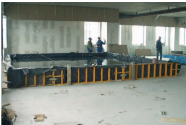
Rys. 3. Obciążenie próbne realizowane za pomocą wody w specjalnym zbiorniku