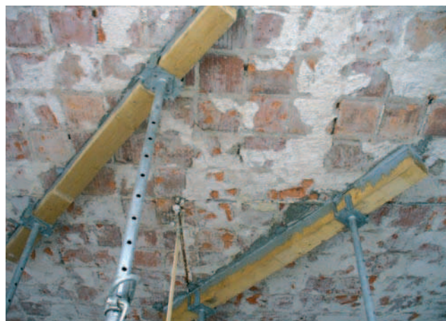
Rys. 6. Rozkładanie obciążenia na stropie