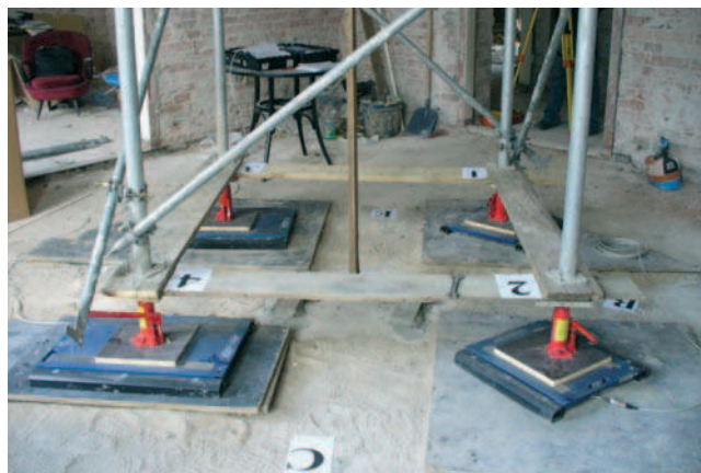
Rys. 4. Obciążenia próbne realizowane za pomocą układu siłowników i podpór szalunkowych

Obciążenie wodą pozostawano na poszczególnych stropach od kilku godzin do całej doby. Badania ugięć stropów realizowano za pomocą pomiarów geodezyjnych na spodzie obciążonego stropu (sufit niższej kondygnacji). Punkty pomiarowe były rozłożone na środku i obwodzie pola obciążonego, dodatkowe punkty kontrolne znajdowały się na polach sąsiednich (nieobciążonych).