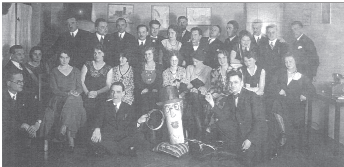
2. Le Corbusier wśród śląskich architektów ok.1929 r., w: E. Stachura, Życie i twórczość architekta Tadeusza Michejdy , Muzeum Śląskie, Katowice 2000, s. 41