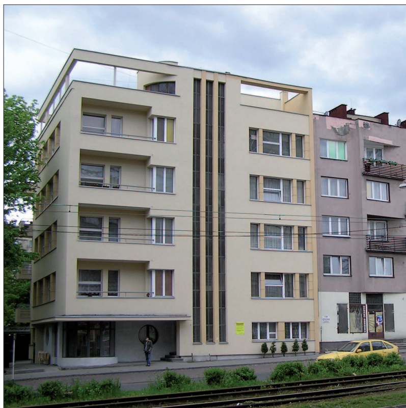
4. Dom B. Radowskiego w Katowicach, proj. Karol Schayer, 1937 4. House of B. Radowski in Katowice, by Karol Schayer, 1937