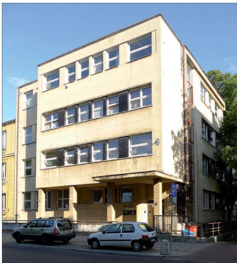
5. Willa Chmielewskich w Warszawie, proj. Karol Schayer, 1937-1938, przebudowana po 1945, 5. Chmielewski's Villa in Warsaw, by Karol Schayer, 1937-1938, rebuilt after 1945