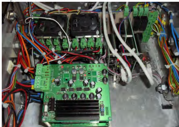
Rys. 4. Moduły elektroniczne sterujące robotem Fig. 4. Electronic modules that control the robot

Operator przy wykorzystaniu autorskiej aplikacji z zaimplementowaną analizą sygnału elektroencefalograficznego jest w stanie prowadzić robota w przestrzeni architektonicznej domu, mieszkania, pracy. Jednakże z uwagi na sporą złożoność i mogące wystąpić duże zaszumienie, sygnału pochodzącego z elektroencefalografu rozpoznanie potencjałów wywołanych sztucznie i zdekodowanie ich przy pomocy algorytmów autorskiej aplikacji jest procesem złożonym. Oprogramowanie sterowników robota zostało tak przygotowane, by w przypadku nadejścia błędnie zdekodowanego polecenia zostało ono odrzucone.