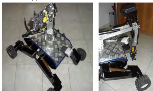
Rys. 3. Widok ogólny robota wraz z manipulatorem

W celu łatwiejszego pokonywania przeszkód przez jednostkę mobilną, wyposażono robota (rys. 3.) w szereg technologii. Zaimplementowano najnowsze rozwiązania sprzętowe takie jak m.in. czujniki dystansu ultradźwiękowe, czujniki akcelerometryczne typu MEMS (ang. Microelectronic and Microelectromechanical Systems), rozmieszczone na kończynach robota oraz w centralnej części korpusu, kamery cyfrowe oraz skaner laserowy. Komunikacja operatora z robotem odbywa się bezprzewodowo z wykorzystaniem standaryzowanej technologii IEEE 802.11 (ang. Wireless Fidelity – WiFi) [7]. Poszczególne moduły platformy komunikują się między sobą za pośrednictwem lokalnej sieci Ethernet (wewnątrz korpusu robota), której poszczególne elementy zamontowano na jednostce mobilnej. Komunikacja zewnętrzna, z aplikacją na stacji roboczej, odbywa się bezprzewodowo z wykorzystaniem standardu WiFi [8].