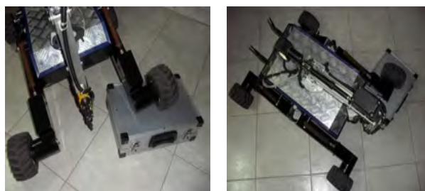
Rys. 2. Robot bez problemu pokonuje ewentualne przeszkody na drodze

mów ujawniający się w obszarach zamkniętych, gdzie konieczne jest swobodne przemieszczanie się pomiędzy licznymi przeszkodami architektonicznymi. Waga jednostki nie przekracza 12 kg. Dodatkowo robot może zostać wyposażony w sprzęt o wadze około 4 kg.