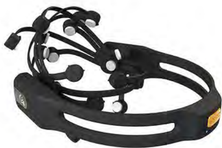
Rys. 1. Emotiv EPOC Neuroheadset

Najbardziej znane na świecie komercyjne rozwiązanie bazujące na zastosowaniu interfejsu mózg-komputer w praktyce, to urządzenie Emotiv EPOC Neuroheadset (rys. 1.) firmy Emotiv Inc. Urządzenie poprzez zaimplementowaną technologię połączenia bezprzewodowego, przesyła dane pobierane z elektrod przymocowanych do skóry głowy na stację roboczą, wyposażoną w odbiornik sygnału.