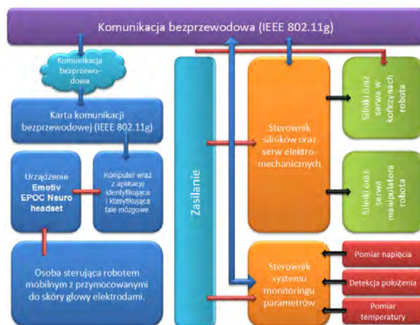
Rys. 6. Schemat pracy systemu sterowania robotem Fig. 6. Scheme of the control system with robot

Elementem poddawanym procesowi sterowania jest robot mobilny, opisany w punkcie czwartym niniejszego artykułu. Na rys. 6 przedstawiony został ogólny schemat pracy systemu sterowania robotem, z uwzględnieniem metody komunikacji pomiędzy stacją roboczą, a robotem oraz pomiędzy stacją roboczą, a urządzeniem firmy Emotiv Inc. [10].