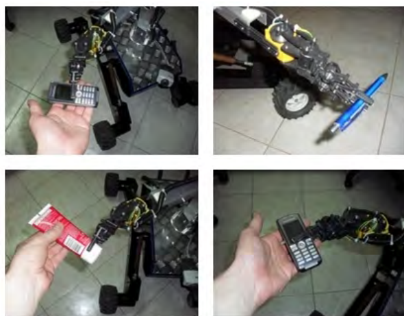
Rys. 5. Przykład praktycznego zastosowania robota, podnoszącego różne przedmioty

Operator przy wykorzystaniu autorskiej aplikacji z zaimplementowaną analizą sygnału elektroencefalograficznego jest w stanie prowadzić robota w przestrzeni architektonicznej domu, mieszkania, pracy. Jednakże z uwagi na sporą złożoność i mogące wystąpić duże zaszumienie, sygnału pochodzącego z elektroencefalografu rozpoznanie potencjałów wywołanych sztucznie i zdekodowanie ich przy pomocy algorytmów autorskiej aplikacji jest procesem złożonym. Oprogramowanie sterowników robota zostało tak przygotowane, by w przypadku nadejścia błędnie zdekodowanego polecenia zostało ono odrzucone.