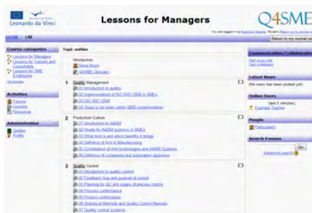
Rys. 4. Zawartość kursu dla kadry zarządzającej