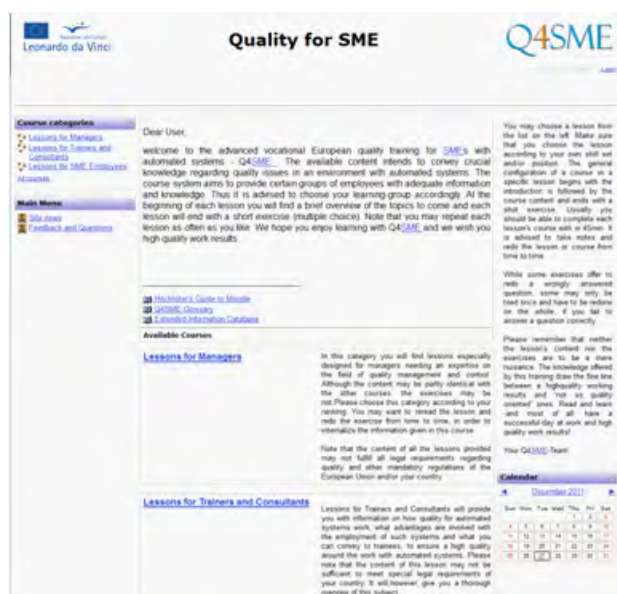
Rys. 2. Strona początkowa systemu Q4SME w języku angielskim Fig. 2. Starting page of Q4SME system in English

Szkolenie stworzono na bazie najlepszej wiedzy oraz praktyki dostępnej w tym czasie dla jego twórców. Oprócz wiedzy transferowanej z poprzednio realizowanych projektów, partnerzy wykorzystali materiały własne stosowane podczas tradycyjnych szkoleń zawodowych. Na wektor działań miały też wpływ opinie zebrane podczas ankiety, przeprowadzonej na wybranej grupie przedsiębiorstw. Po zebraniu i przeanalizowaniu wypełnionych ankiet, opracowanych przy ich pomocy założeń oraz na podstawie materiałów przeznaczonych do wykorzystania przy tworzeniu treści szkoleniowych rozwiązania Q4SME jakie były w dyspozycji partnerów projektu, stworzona została struktura szkolenia, zakres tematyczny i podział na grupy tematów.