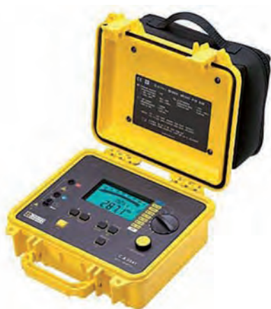
Rys. 2. Cyfrowy miernik rezystancji izolacji CA 6541 firmy Chauvin Arnoux Fig. 2. Measure equipment for measuring resistivity CA 6541 Chauvin Arnoux

Pomiar rezystancji badanych próbek oleju mineralnego wykonano za pomocą cyfrowego miernika izolacji firmy Chauvin Arnoux (rys. 2).