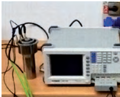
Rys. 1. Stanowisko pomiarowe kąta stratności dielektrycznej Fig. 1. Measure equipment for measuring dielectric loss factor

Pomiary współczynnika strat dielektrycznych \text{tg}\delta wykonano za pomocą mostka LCR-8101 produkcji GW Instek [7], z wykorzystaniem elektrod pomiarowych trójelektrodowych na próbce cylindrycznej (rys. 1). Pomiar odbywał się dla częstotliwości 50 Hz.