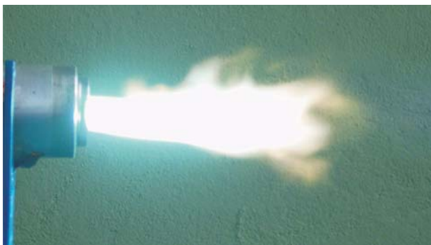
Rys. 3. Plazma wytwarzana w plazmotronie łukowym. Moc plazmotronu: 15 kW. Gazem plazmotwórczym jest powietrze

Powyższe przykłady to tylko kilka z ogromnej liczby źródeł i sposobów wytwarzania plazmy. Plazmą jest iskra elektryczna w świecy zapłonowej, wyładowanie barierowe wokół elektrody, łuk elektryczny i wyładowanie koronowe np. z generatora wysokiego napięcia Tesli.