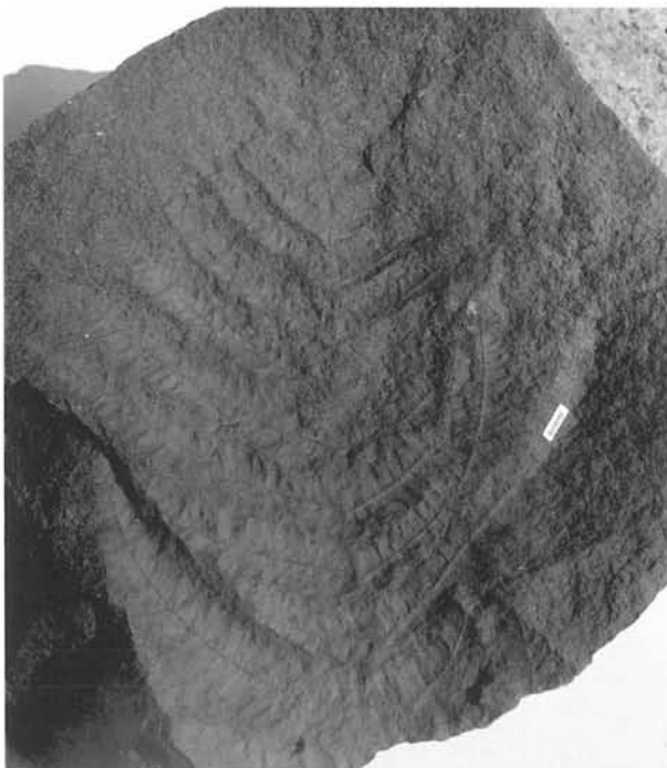
Fig. 2. Cladophlebis antarctica Halle, skala 1 cm.

Frenguelli, Sagenopteris paucifolia (Philips) Ward, Thinnfeldia constricta Halle, Ticoa jeffersonii Gee, sagowców – Nilssonia taeniopteroides Halle, Pseudoctenis ensiformis Halle, benetytów – Cycadolepis sp., Otozamites linearis Halle, O. rowleyi Gee, Weltrichia sp., Williamsonia pusilla Halle, Zamites anderssonii Halle, Z. antarcticus Halle emend. Archangelsky & Baldoni, Z. pachyphyllus Halle, Z. pusillus Halle i roślin szpilkowych – Araucaria antarctica Gee, Brachyphyllum sp., Elatocladus heterophyllum Halle, E. confertus (Oldham & Morris) Halle, E. jabalpurensis (Feistmantel) Halle, Pagiophyllum feistmantelii Halle emend. Townrow, Pagiophyllum sp. A, Pagiophyllum sp. B.