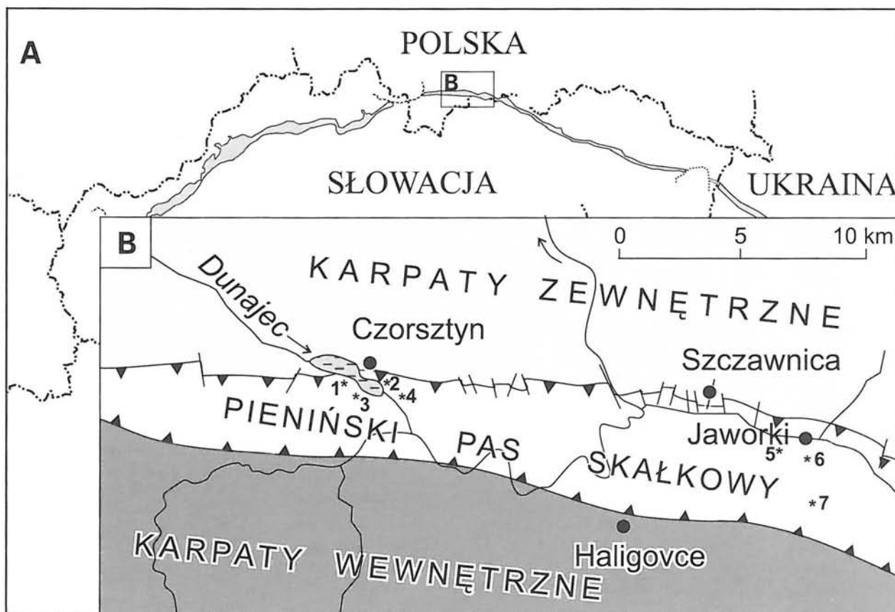
Fig. 1. Pozycja pienińskiego pasa skałkowego (A) z zaznaczeniem stanowisk (*) opisanych w tekście (B): 1 – Falsztyn; 2 – Czorsztyń-Sobótka; 3 – Niedzica-Podmajerz; 4 – Flaki; 5 – potok Krupianka; 6 – Czajakowa Skata; 7 – Wysokie Skalki.

Złożona historia pienińskiego pasa skałkowego znajduje wyraz w bardzo skomplikowanej budowie