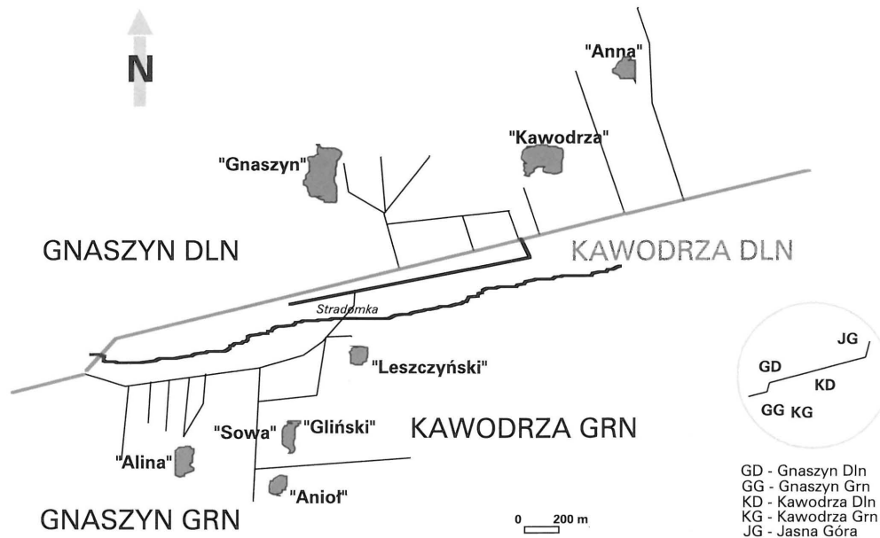
Fig. 1. Mapa lokalizacyjna odstonień.