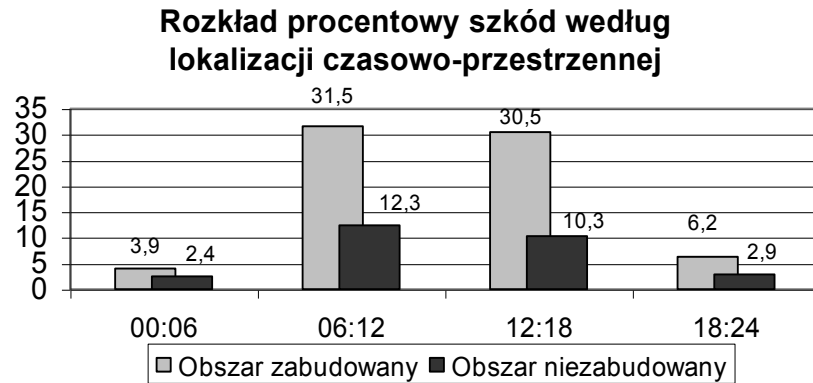
Rys. 2. Rozkład godzinowy szkód w obrębie doby w obszarze zabudowanym i poza nim [2,3]

Fig. 2. A description of road traffic damages according to the time of day and in built-up and non-built-up areas [2,3]