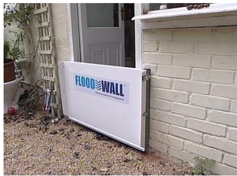
Rys. 4. Ściany przeciwpowodziowe [Floodwall 2010] Fig. 4. Flood wall [Floodwall 2010]

Kolejnym sprawdzonym pomysłem są bariery ochronne, w różnych wersjach i modułach (rys. 5 i 6). Składają się one z jednego lub kilku rzędów tubusów, które po napełnieniu wodą wytworzą nieprzepuszczalną barierę. Ważnym elementem takich rozwiązań jest to, iż w zależności od potrzeb, można je łączyć modułowo, dostosowując przegrodę do warunków miejscowych. Ten rodzaj zabezpieczenia jest możliwy do wielokrotnego użycia – po akcji łatwo barierę opróżnić, wyczyścić i składować.