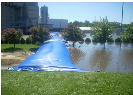
Rys. 5. Przeciwpowodziowa bariera ochronna Rubena C-120 [Polcomplex 2010] Fig. 5. Flood barrier type C-120 [Polcomplex 2010]

Kolejnym sprawdzonym pomysłem są bariery ochronne, w różnych wersjach i modułach (rys. 5 i 6). Składają się one z jednego lub kilku rzędów tubusów, które po napełnieniu wodą wytworzą nieprzepuszczalną barierę. Ważnym elementem takich rozwiązań jest to, iż w zależności od potrzeb, można je łączyć modułowo, dostosowując przegrodę do warunków miejscowych. Ten rodzaj zabezpieczenia jest możliwy do wielokrotnego użycia – po akcji łatwo barierę opróżnić, wyczyścić i składować.