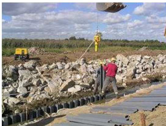
Rys. 1. Przykład zastosowania ścianek szczelnych w ochronie przeciwpowodziowej [Minbud 2010]

Coraz częściej stosowane są winylowe ściany palowe typu C-LOC (rys. 1).