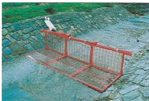
Rys. 2. Przenośne wały przeciwpowodziowe typu PPH070 [Reoamos 2010]

Niewątpliwą nowością na rynku zabezpieczeń przeciwpowodziowych są przenośne wały przeciwpowodziowe. Wał tego typu, np. PPH070 (rys. 2) składa się ze stosunkowo lekkiej, bo ważącej zaledwie 18 kg, metalowej konstrukcji o wymiarach 0,7 m x 1,0 m, na którą nakłada się fartuch techniczny (np. wytrzymałą folię). Producent reklamuje ten produkt jako niezawodny i szybki w montażu, a ponadto – nie wymagający użycia urządzeń mechanicznych czy specjalnie wyszkolonej obsługi. Producent gwarantuje: wysoką stabilność i trwałość wału bez konieczności kotwienia, nieograniczoną długość, lekkość konstrukcji, jak również trwałość i doskonałą szczelność wału.