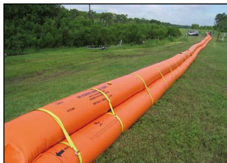
Rys. 6. Przeciwpowodziowa bariera ochronna PPB015 [Reoamos 2010] Fig. 6. Flood barrier type PPB015 [Reo- amos 2010]