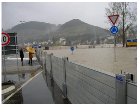
Rys. 3. Zapory przeciwpowodziowe [IBS Polska 2010] Fig. 3. Flood wall [IBS Polska 2010]

Innym typem przenośnych obwałowań są – stosowane z powodzeniem od wielu lat w Niemczech, Holandii i Anglii – przeciwpowodziowe zapory wodne (rys. 3) oraz ściany przeciwpowodziowe (rys. 4).