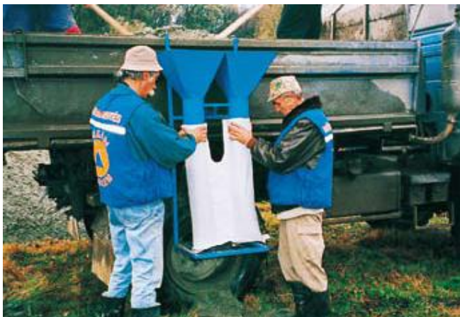
Rys. 7. Propylenowe dwukomorowe worki przeciwpowodziowe [Reoamos 2010]

dukty te mogą być używane kilkakrotnie, a sam sposób ich ułożenia (na tzw. zakładkę, tj. w miejscu przegrody jednego worka układa się komorę drugiego worka) podnosi efektywność zabezpieczenia przeciwpowodziowego.