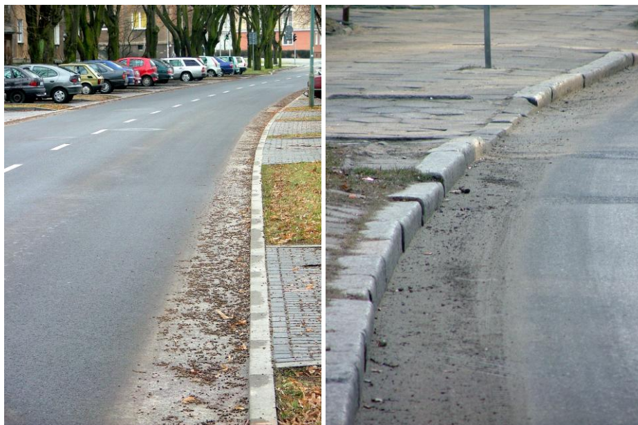
Fot. 1-2. Miejsca poboru próbek pyłu drogowego: ul. Wyspiańskiego i ul. Bema [Walczak 2010]