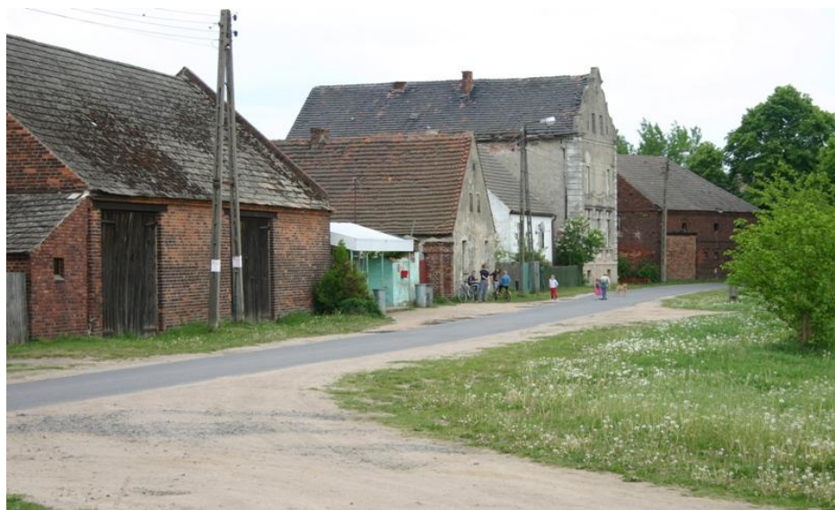
Fot. 1. Przykład zabudowy rejonu złoża – wieś Strzegów [Naworyta 2008] Phot. 1. Example of development of coal reservoir area - a Strzegów village [Naworyta 2008]

Na terenach złoża zinwentaryzowano obiekty, które zostały wpisane do rejestru Wojewódzkiego Konserwatora Zabytków. Wśród nich: późnogotycki kościół w Strzegowie, neogotycki kościół z XIX w. we wsi Mielno oraz dwa domy mieszkalne o konstrukcji szachulcowo-murowanej, pałac klasycystyczny z końca XVIII w. we wsi Grabice użytkowany po wojnie przez PGR, pałac z XIX w. we wsi Luboszyce. Stan techniczny zabudowań pałacowych i folwarcznych ze względu na brak właściwego zagospodarowania jest zły.