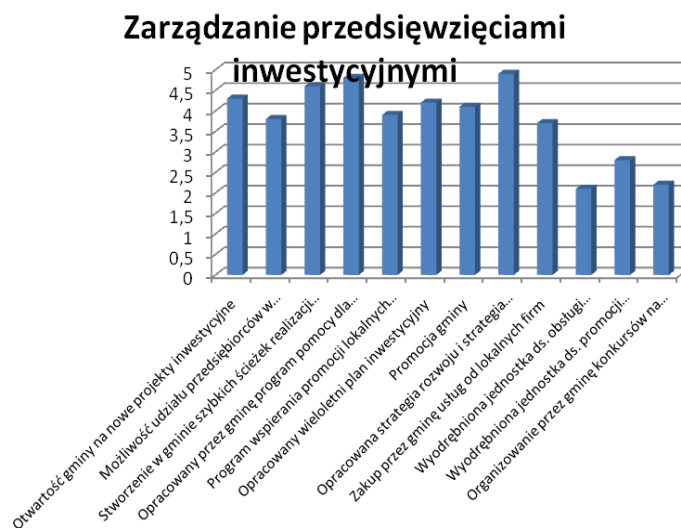
Rys. 1. Graficzna prezentacja oceny instrumentów związanych z zarządzaniem przedsięwzięciami inwestycyjnymi

Graficzną prezentację oceny wybranych instrumentów przez przebadanych respondentów prezentują kolejno rysunki 1-3.