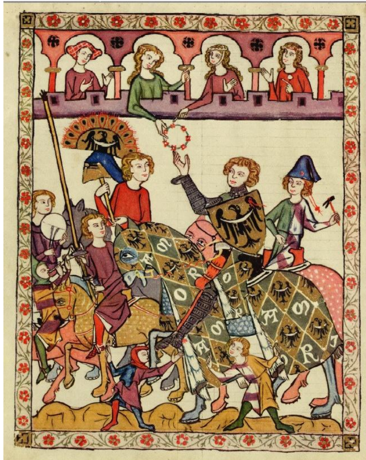
Rys. 2. Książę Henryk Probus jako zwycięzca turnieju odbierający wieniec od dam 3

Powstały w XIV wieku Codex Manesse był największym zbiorem średniowiecznej poezji. Spisany przez minnesingerów , dla których inspiracją byli francuscy trubadurowie, bogato ilustrowany przedstawia sceny z życia szlachty, takie jak polowania, turnieje rycerskie i wojny, porwania dam, gry i zabawy dworskie itp. Przechowywany w najstarszej niemieckiej uczelni – Uniwersytecie Ruprechta-Karola w Heidelbergu, stanowi cenne źródło informacji o strojach, uzbrojeniu oraz czynnościach właściwych dla ludzi żyjących w tym okresie. Na jednej z miniatur przedstawiono Henryka Probusa, księcia wrocławskiego (1257-1290), jako zwycięzcę turnieju rycerskiego. Świadczy to zarówno o popularności tej dyscypliny wśród szlachty, jak i o eksterytorialnej znajomości genealogii i heraldyki wśród skrybów i heroldów.