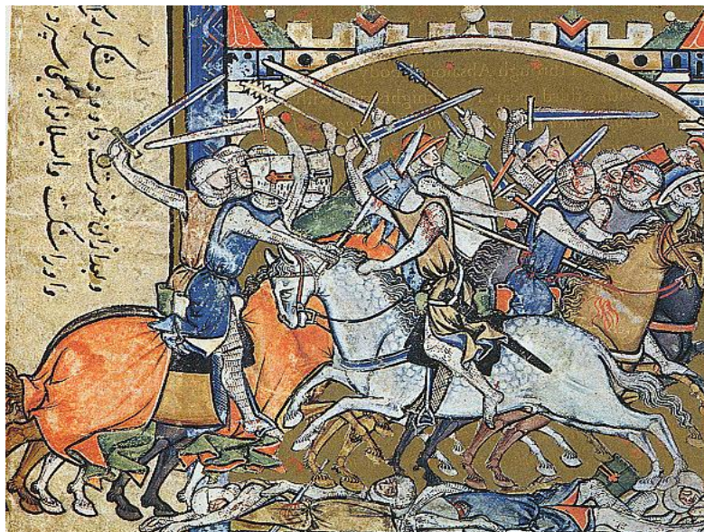
Rys. 3. Rycerze króla Dawida pokonują wojowników zbuntowanego syna Absaloma 5

Maciejowskiego , która swoją nazwę wzięła od kardynała Bernarda Maciejowskiego 4 . Dzieło to zawiera sceny ze Starego Testamentu, które przedstawione we właściwy dla historiografii sposób – obrazują typowe dla XIII wieku przedmioty życia codziennego, stroje, uzbrojenie i wyposażenia.