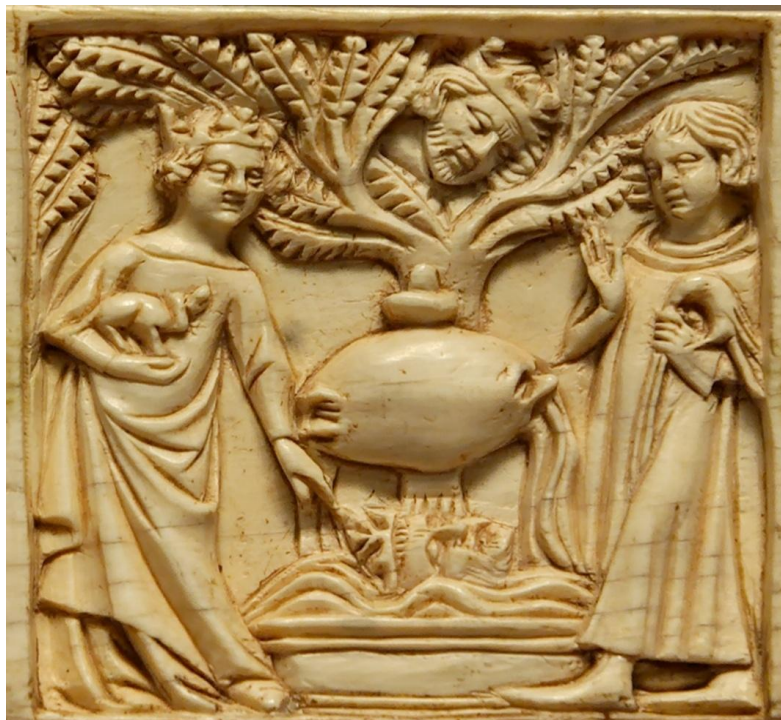
Rys. 4. Tristan i Izolda przy fontannie, kość słoniowa (1340-1350), Musee du Louvre, Paryż 10 Źródło: [online]. [dostęp: 30.10.2011]. Dostępny w Internecie: http://www.louvre.fr/llv/musee/alaune.jsp?bmLocale=en

miast swój wysiłek skupić na wiernej służbie królowi, zgodnej z zasadami wiary chrześcijańskiej, dbając o osobisty honor i względy dam.