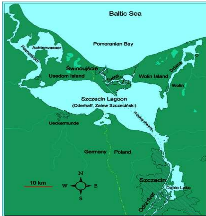
Mapa 2. Usytuowanie Portu w Szczecinie [27-28].