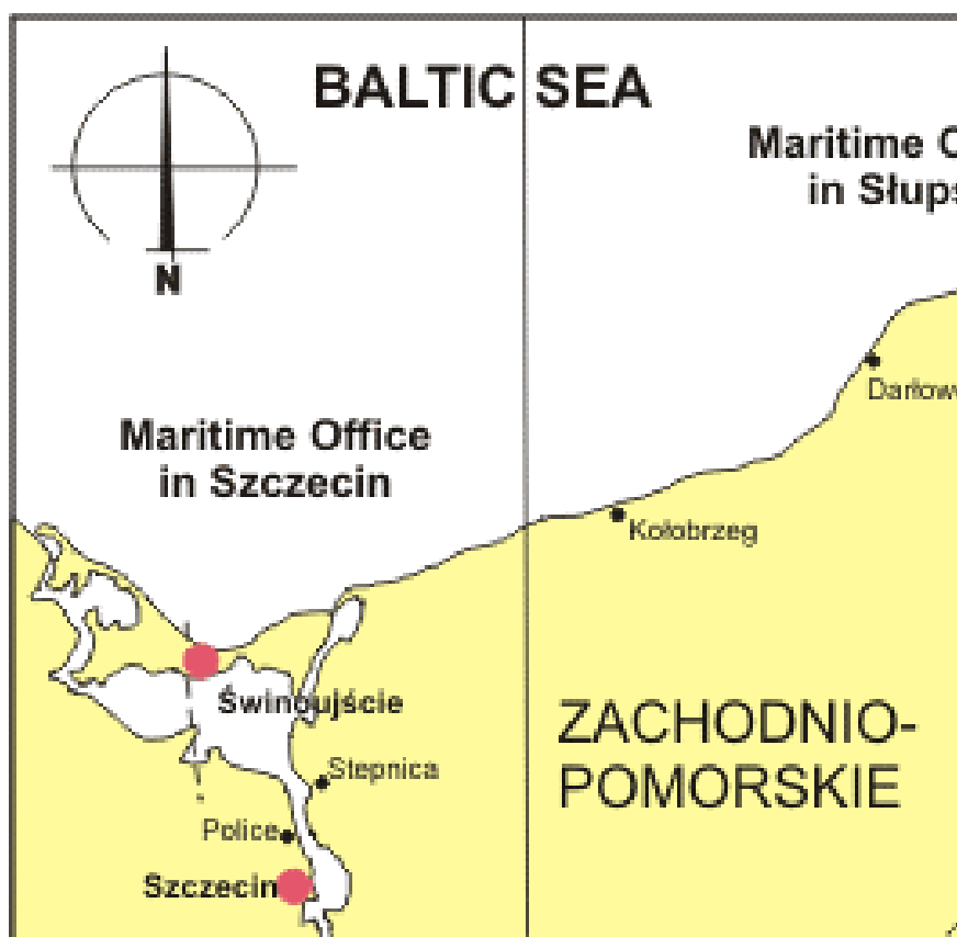
Mapa 1. Usytuowanie Portu w Szczecinie [27-28].

Znajduje się w odległości ok. 69 km na południe od Zatoki Pomorskiej ok. 11 km od Zalewu Szczecińskiego [25-29]. Na mapie nr 1 i 2 przedstawiono usytuowanie Portu w Szczecinie.