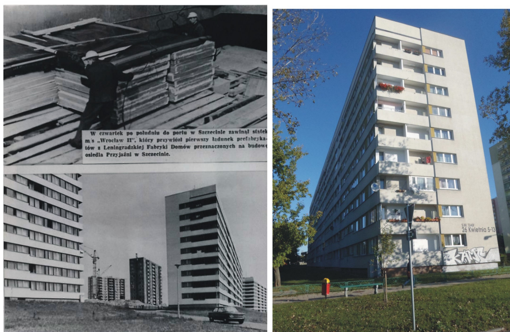
Ryc. 3. Dostawa 9. kondygnacyjnych budynków i ich montaż w Osiedlu Przyjaźń w Szczecinie (1975) – po lewej. „Transatlantyk” przy ulicy 26. kwietnia (2011) – po prawej.

ciasnych, źle zaprojektowanych, wykończonych i wyposażonych mieszkań było zbyt mało w stosunku do umiarkowanych wielkości przyrostu demograficznego i ruchów migracyjnych 16 . W takiej sytuacji strona radziecka przedstawiła ofertę eksportową obejmującą budynki mieszkalne serii 1-LG-600. W dalszej kolejności Centrala Handlu Zagranicznego ( Budimex ) zawarła kontrakt z radzieckim odpowiednikiem ( Technoeksport ) na dostawę i montaż pierwszych sześciu 9 kondygnacyjnych budynków wielorodzinnych w Osiedlu Przyjaźń w Szczecinie (1973). Każdy z nich liczył 9 kondygnacji i 5 klatek schodowych po 36 mieszkań w każdej z nich. Prefabrykaty zostały przetransportowane z Leningradu na Nabrzeże Rumuńskie w Szczecinie statkami Polskiej Żeglugi Morskiej w 13 dniowych odstępach 17 . Ponieważ pojedynczy budynek ważył 24 tysiące ton to do jego przewiezienia niezbędne okazały się trzy kursy.