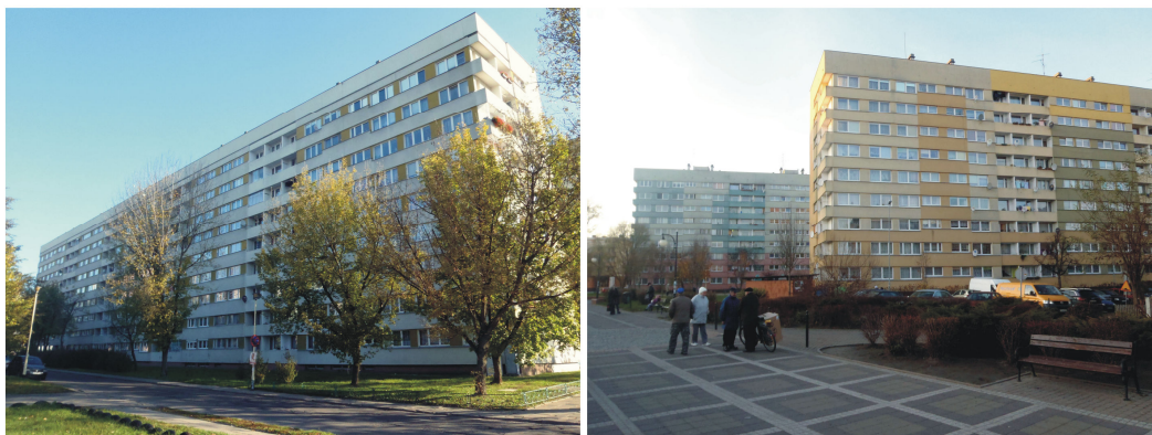
Ryc. 5. „Transatlantyk” w Szczecinie przy ulicy 26 kwietnia (2011) – po lewej oraz „transatlantyki” w Policach przy ulicy Wyszyńskiego (2011) – po prawej.

efektywności ekonomicznej budownictwa z prefabrykowanych elementów wielkowymiarowych stały się koszty ich transportu z wytwórni na plac budowy 23 . Równie istotne okazały się nagminnie wyrażane przez przyszłych lokatorów opinie o chęci zamieszkania nie w budynku „leningradzkim”, lecz polskim 24 . Mimo wszystko cztery pierwsze fabryki domów kupiono w ZSRR. [...] Zagłębie miedziowe w Lubinie dostało zakład prefabrykacji kupiony w NRD. Resztę stanowiły polskie wytwórnie wyposażone w linie produkcyjne systemu Composec francuskiej firmy Balency Briard i zachodnioniemieckiej firmy Kesting (system Wk-70) 25 .