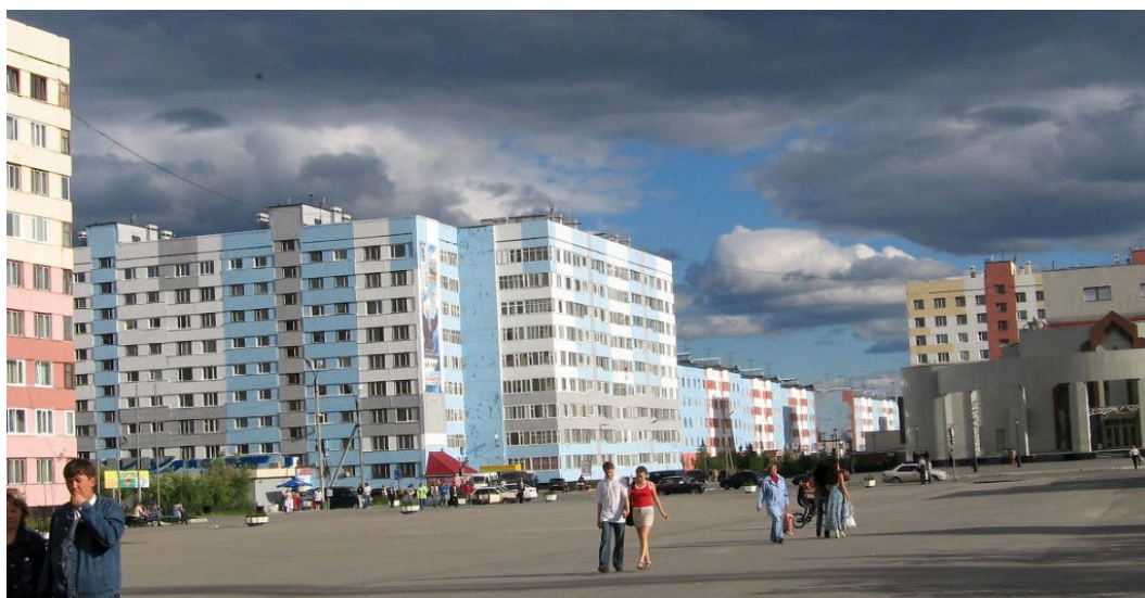
Ryc. 2. Budynki serii 1-LG-600 (Leningrady) w Nowyj Uriengoj. Fig. 2. Residential buildings series 1-LG-600 in Nowyj Uriengoj.

Źródłem niewątpliwych uciążliwości w budynkach serii 1-LG-600 stało się niezapewnienie oświetlenia światłem dziennym wewnątrz kiosków wejściowych, niedostateczna szerokość otworów drzwiowych prowadzących do kabin dźwigowych i ich nieprzystosowanie do przewozu mebli oraz niewydzielenie pionów zsympowych z przestrzeni klatki schodowej. Z kolei w mieszkaniach całkowicie niewystarczająca okazała się powierzchnia użytkowa kuchen w mieszkaniach (od 6,1 metra kwadratowego do 6,3), brak w nich przedpokojów oraz nieuzasadnione według polskich przepisów podniesienie dolnej krawędzi okien w pomieszczeniach mieszkalnych 14 . Mimo tych wszystkich niedogodności podjęto decyzję o masowym zastosowaniu „transatlantyków” na terenie obwodu leningradzkiego, w odległych zakątkach Związku Radzieckiego (Nowyj Uriengoj), a nawet dostrzeżono możliwości ich eksportu 15 .