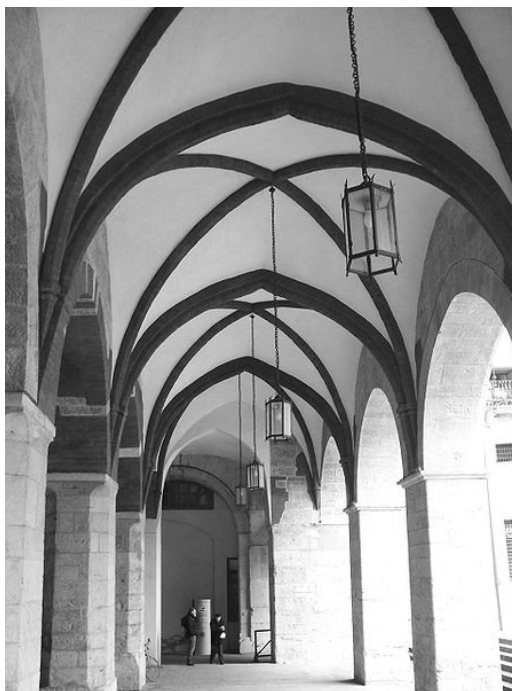
Ryc. 2. Broletto w Brescii. Krużganki dziedzińca.