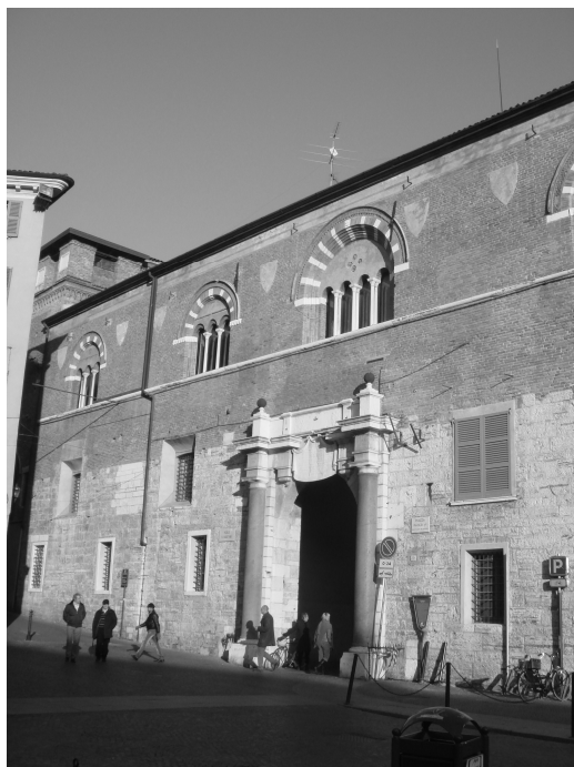
Ryc. 1. Broletto w Brescii.

We Włoszech północnych ratusze były zwykle budowlami dwukondygnacyjnymi 2 . We wczesnych ratuszach parter, zamknięty zewnętrznymi ścianami, wewnątrz mógł mieścić dziedziniec z podcieniami arkadowymi (np. Broletto w Brescii, 1187 r. – ryc. 1, 2).