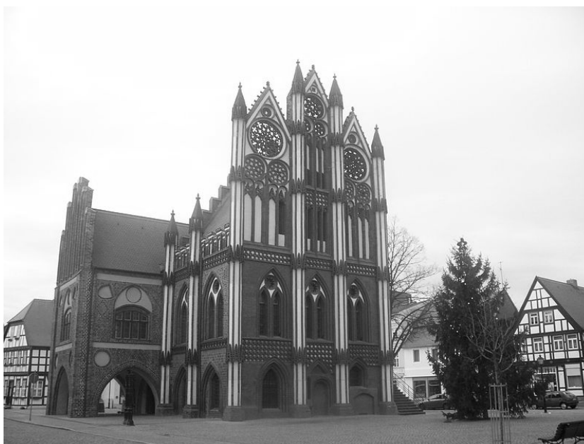
Ryc. 7. Ratusz w Tangermünde.