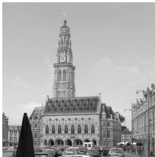
Ryc. 10. Ratusz w Arras.

zynowe lub skład broni. Piętro mieściło reprezentacyjną salę wraz z przylegającymi pokojami administracyjnymi 17 (np. ratusz w Arras – ryc. 10).