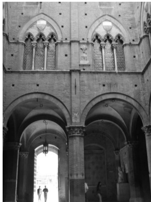
Fig. 4. Palazzo Pubblico in Siena.

Ryc. 5. Palazzo Pubblico w Sienie. Dziedziniec.