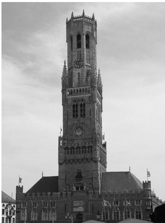
Ryc. 9. Ratusz w Brugii.

Fig. 8. The Town Hall in Münster.