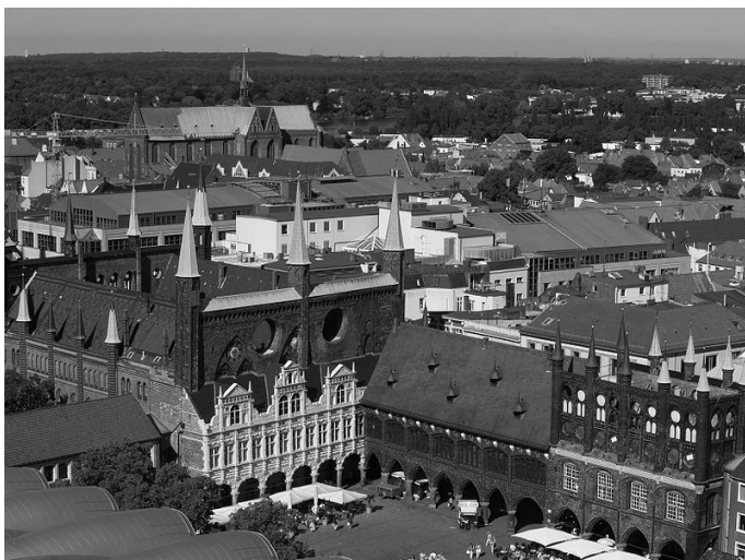
Ryc. 6. Ratusz w Lubece.

Oprócz jednoprzestrzennej Sali Rady na piętrze, mniejszych pomieszczeń w parterze i na pozostałych kondygnacjach, niektóre ratusze posiadały kaplicę (Palazzo Vecchio we Florencji).