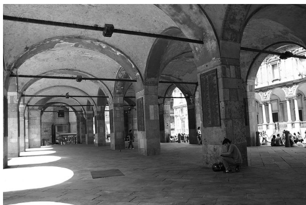
Fig. 3. Broletto Nuovo in Milano.

Piętro zajmowała jednoprzestrzenna sala obrad samorządu. Otwierała się ona balkonem w stronę placu, przy którym zwykle stał ratusz. Z balkonu ogłaszano postanowienia władz miasta. Podobną funkcję mógł pełnić spocznik zewnętrznych schodów, znajdujący się na wysokości pierwszego piętra.